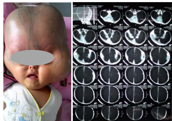
Gambar 2. Foto pasien dan CT Scan kepala saat usia 6 bulan

Pasien ini terdapat obstruksi parsial jalan nafas dimana didapatkan suara stridor pada saat benafas, walaupun stridor ini berkurang saat dilakukan ekstensi leher dengan mengangkat bahu pasien namun stridor masih tetap terdengar yang diperkirakan terdapat obstruksi pada jalan nafas karena adanya midfasial hipoplasia dan juga berpotensi penyulit saat manajemen jalan nafas baik itu sulit ventilasi dan sulit intubasi. Namun pada saat dilakukan ventilasi dengan facemask ventilasi bisa dikuasai dengan bantuan oropharyngeal airway dan