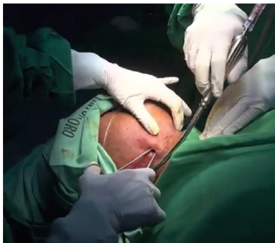
Gambar 2. Insisi Drainase Abses Submandibula

Medan operasi menjalani proses aseptik sebelum insisi dilakukan pada area mandibula. Durasi operasi adalah 60 menit, dengan tekanan darah sistolik berkisar antara 110-120 mmHg, tekanan darah diastolik 60-80 mmHg, dan laju nadi 70-85 denyutan per menit. Volume perdarahan selama operasi tercatat sebanyak 100 cc, sementara output urin pasien adalah 100 cc selama periode operasi. Pasien menerima total cairan kristaloid sebanyak 500 cc selama prosedur.