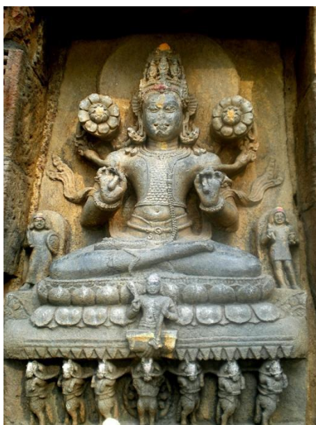
Gambar 1. Arca Dewa Surya dalam Sikap Duduk pada Abad Ke-13 di Odisha, India

Perwujudan arca Dewa Surya yang ada di Jawa ini menunjukkan adanya kesesuaian dengan perwujudan arca Dewa Surya yang ada di India (Lihat Gambar 1 dan Gambar 2). Memang tidak seluruhnya sama persis, karena setiap pembuat arca tampaknya punya subjektivitas masing-masing, namun hal ini secara garis besar tidak jauh berbeda. Jika didasarkan pada tiga kriteria ciri ikonografis yang digunakan, maka terdapat kesesuaian antara representasi Dewa Surya dalam bentuk arca di Jawa dengan di India dan sebagaimana yang dimaksud dalam Matsya Purana . Satu hal yang tampak membedakan adalah adanya kusir Dewa Surya yang bernama Aruna dalam ciri ikonografis di India (Lihat Gambar 1 dan Gambar 2).