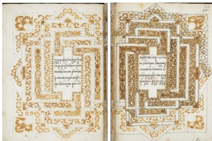
Gambar 2. Pola iluminasi Jaya Lengkara Wulang