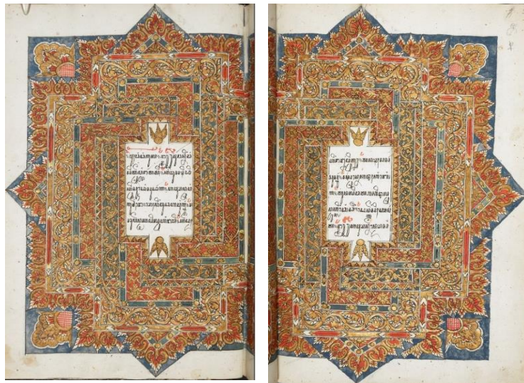
Gambar 1. Iluminasi Jaya Lengkara Wulang