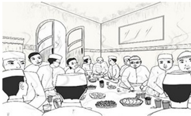
Ilustrasi: Matilda KD (@tildasmisul di Instagram)

Gambar 3. Ilustrasi suasana rapat persiapan menjelang gelaran sound horeg : para lelaki duduk melingkar, membahas iuran, vendor, hingga logistik acara. Rapat-rapat seperti ini menjadi panggung awal munculnya struktur kuasa baru di tingkat lokal, ketika keputusan, suara, dan kemampuan mendikte arah pembahasan menjadi modal performatif bagi mereka yang ingin tampil sebagai aktor penting dalam pesta horeg