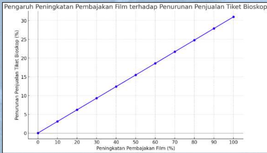
Gambar 1: Elastisitas Pembajakan Film Terhadap Penjualan Tiket Bioskop di Tiongkok