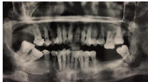
Gambar 1. Pemeriksaan radiografi OPG pasien. Pemeriksaan menunjukkan terdapat kehilangan tulang baik arah horizontal maupun vertikal

Pasien memberi persetujuan tindakan medis untuk mendapat perawatan periodontal dengan aplikasi PRF dan Gel RSV 1,2% pasca bedah periodontal. Pasien juga telah menyetujui penulisan hasil perawatan terdokumentasi dan terpublikasi dalam studi kasus ini.