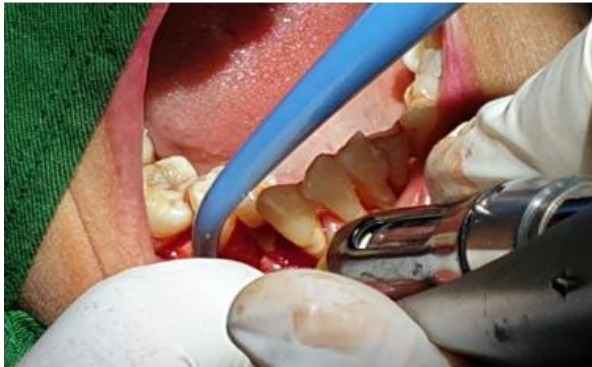
Gambar 3. Anestesi infiltrasi pada area kerja