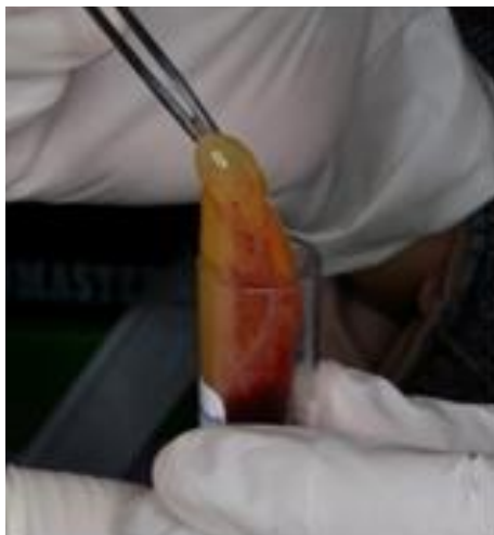
Gambar 5. Preparasi PRF