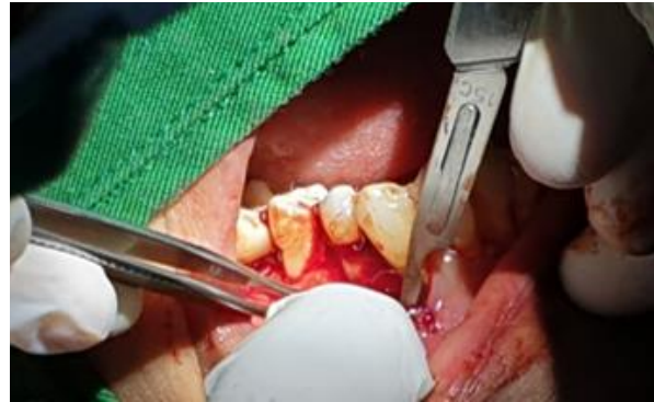
Gambar 4. Incisi full thickness flap pada area kerja