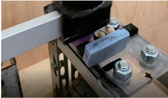
Gambar 2. Penyikatan spesimen penelitian menggunakan mesin penyikat otomatis