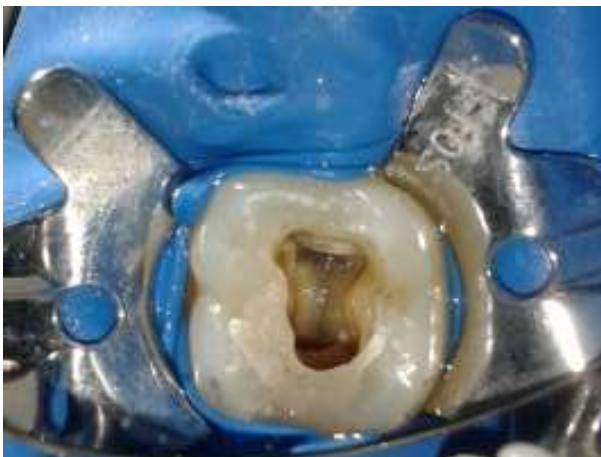
Gambar 3. Gigi 46 setelah dilakukan rewalling dinding distal. Terlihat 4 orifis pada gigi 46, yaitu orifis mesiobukal, mesiolingual, distobukal dan distolingual.

Preparasi saluran akar dilakukan menggunakan rotary file dengan desain rectangular cross-section (ProTaper Next®, Dentsply Maillefer,