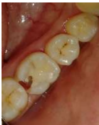
Gambar 1. Gambaran klinis gigi 46 dilihat dari oklusal. Terdapat kavitas dengan kedalaman dentin pada permukaan disto-oklusal gigi 46. Terlihat adanya tumpatan semen ionomer kaca pada dasar kavitas. Terlihat pula adanya tumpatan resin komposit pada permukaan oklusal gigi 46.

Berdasarkan hasil pemeriksaan subjektif, pemeriksaan objektif dan pemeriksaan penunjang (pemeriksaan radiografis), diagnosis kasus ini adalah pulpitis ireversibel disertai periodontitis apikalis. Rencana perawatan pada kasus ini adalah pulpektomi dan restorasi resin komposit kelas II dengan penguat pasak fiber pre-fabricated pada gigi 46. Prognosis kasus ini adalah baik karena sisa jaringan keras gigi masih banyak, saluran akar terlihat jelas, serta pasien kooperatif. Pada kunjungan pertama dilakukan pemeriksaan subjektif, pemeriksaan objektif, foto intraoral, radiograf, kemudian ditentukan diagnosis dan rencana perawatan. Pasien diberi penjelasan mengenai prosedur perawatan dan biaya serta waktu perawatan. Pasien menyetujui tindakan perawatan ini dan pasien menandatangani informed