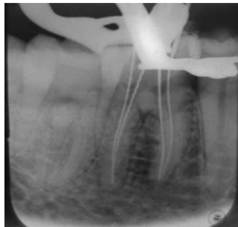
Gambar 4. Radiograf pengukuran panjang kerja saluran akar pada gigi 46.