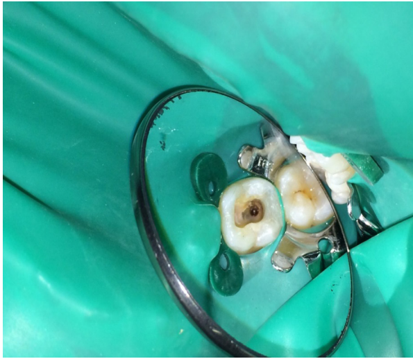
Gambar 8. Gigi 46 setelah rewalling dinding distal menggunakan resin komposit

Pengurangan guta perca dilakukan menggunakan peesoo reamer (Largo® Peeso Reamer, Dentsply Maillefer, Ballaigues, Switzerland), kemudian dilanjutkan dengan preparasi saluran pasak.