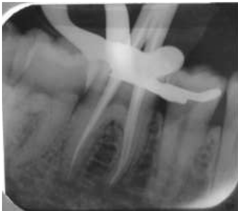
Gambar 6. Radiograf periapikal pengepasan poin guta perca.