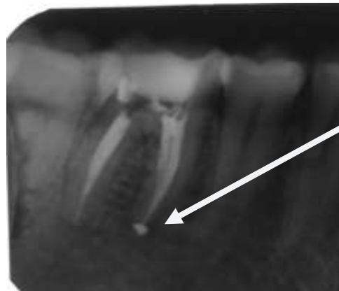
Gambar 7. Hasil obturasi saluran akar pada gigi 46. Terlihat saluran akar telah terisi secara hermetis, serta terdapat sealer puff pada ujung apikal akar mesiobukal gigi 46

kemudian dibilas dengan alkohol 70% (OneMed Alkohol 70%, PT. Inti Medicom Retailindo, Surabaya) dan dikeringkan. Saluran akar diirigasi dengan larutan NaOCl 2,5% (OneMed NaOCL 2,5%, PT. Inti Medicom Retailindo, Surabaya) selama 5 menit dan EDTA cair 17% (Smear Clear®, SybronEndo, Orange, California, USA) selama 1 menit, kemudian dibilas menggunakan salin dan dikeringkan dengan paper point steril. Obturasi saluran akar dengan guta perca single cone menggunakan siler berbahan dasar resin epoksi (TopSeal®, Dentsply Maillefer, Ballaigues, Switzerland). Siler resin dimasukkan ke dalam saluran akar menggunakan lentulo spiral (Paste Filler, Sendoline, Stockholm, Sweden) yang telah ditandai rubber stop 2/3 panjang kerja, kemudian diputar dengan low speed handpiece (Contra Angle Handpiece Latch Bur, Nakanishi Inc., Tochigi, Japan). Konus guta perca (Protaper Next™ gutta percha point X2, Dentsply Maillefer, Ballaigues, Switzerland) diolesi siler resin (TopSeal®, Dentsply Maillefer, Ballaigues, Switzerland) pada 1/3 apikal, kemudian dimasukkan ke dalam saluran akar. Pengisian saluran akar dilakukan pada masing-masing saluran akar, kemudian guta perca dipotong 2 mm dari orifis ke arah apikal dengan plugger (Gutta-Percha Plugger, Dentsply Maillefer, Ballaigues, Switzerland) yang dipanaskan dan dikondensasi secara ringan. Setelah itu, orifis mesiobukal, mesiolingual, dan distobukal ditutup