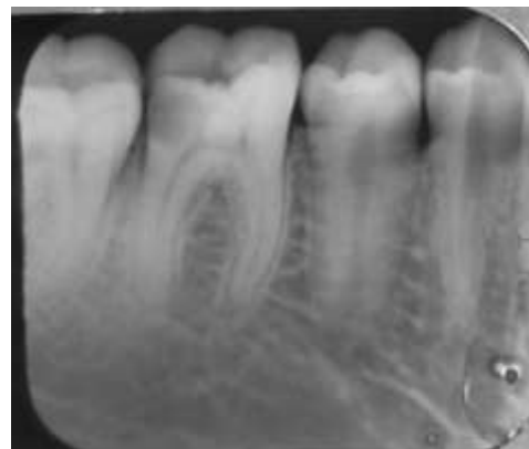
Gambar 2. Radiograf preoperatif gigi 46, terdapat kavitas dengan pulpa terbuka pada bagian tanduk pulpa saluran akar distal gigi.

Karies dibersihkan sampai didapatkan jaringan dentin yang sehat dengan ekskavator sendok dan round metal bur . Akses kavitas dibuka menggunakan open access bur (Endo Access Bur, Dentsply Maillefer, Ballaigues, Switzerland), kemudian dilakukan pemotongan atap pulpa menggunakan non-cutting tip tapered bur (Diamendo, Dentsply Maillefer, Ballaigues, Switzerland). Ditemukan 4 buah orifis, yaitu mesiobukal, mesiolingual, distobukal dan distolingual. Dilakukan ekstirpasi jaringan pulpa menggunakan barbed broach (Barbed Broaches, Sendoline, Stockholm, Sweden), kemudian diirigasi menggunakan NaOCl 2,5% (OneMed NaOCL 2,5%, PT. Inti Medicom