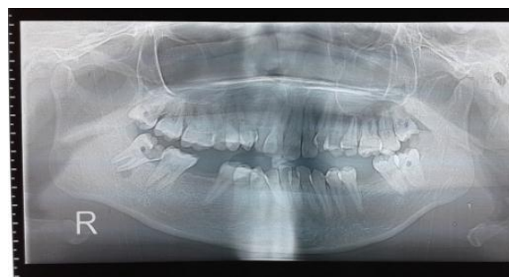
Gambar 3. Inisial panoramik tampak gigi 48 erupsi sebagian mengalami karies profunda dan terbukanya pulpa disertai area radiolusen terlokalisir pada periapiks akar mesial 48 gigi 47 mengalami karies profunda pada sisi distal

Berdasarkan anamnesa, pemeriksaan klinis dan penunjang, dibuatlah suatu diagnosis klinis yaitu impaksi gigi 18, 28, 38, 48 disertai osteomyelitis kronis suppuratif mandibula dextra. Penatalaksanaan meliputi nekrotomi debridemen, sequesterectomi, ekstraksi gigi 18, 28, 38, 48, dan 47 dalam anestesi umum. Dilakukan insisi flap pada area didepan gigi 47 sampai ke posterior, kemudian flap dielevasi. Gigi 48 diekstraksi dengan bantuan bein, diikuti ekstraksi gigi 47 dan jaringan sequester diangkat dengan bantuan bur tulang disertai irigasi dengan larutan NaCl 0,9%. Jaringan granulasi di bawah sequester dibersihkan sampai tampak tulang sehat yang terdapat perdarahan. Pada