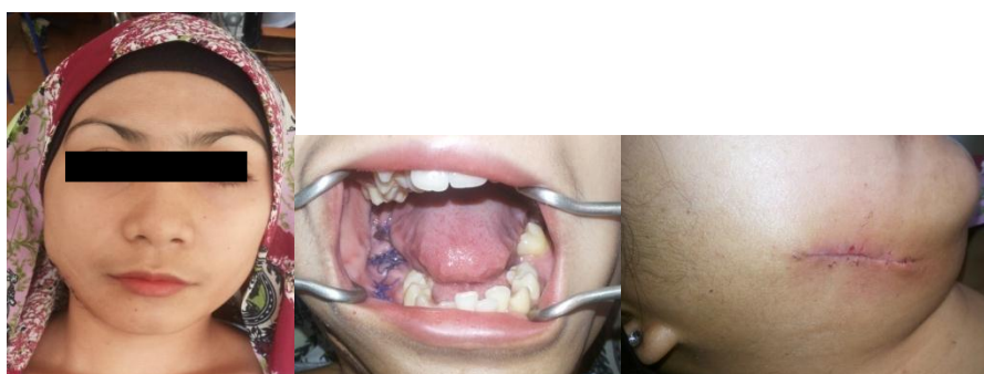
Gambar 5. Keadaan pasien saat kontrol hari ke -7

Pasien kontrol satu minggu kemudian tanpa adanya keluhan dan tampak keadaan intra oral tampak jaringan epitelisasi pada daerah post penjahitan luka (Gambar 5). Pasien lalu disarankan untuk mengkonsumsi Clindamycin kapsul 3 x 300 mg selama 2 minggu. Hasil pemeriksaan histopatologi jaringan mengkonfirmasi bahwa jaringan yang diperiksa sesuai dengan diagnosis osteomielitis supuratif kronis mandibula.