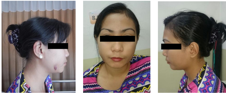
Gambar 1. Ektra Oral tampak pembengkakan pada mandibula dextra