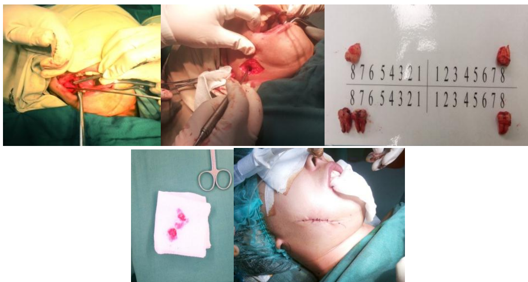
Gambar 4. Foto durante operasi