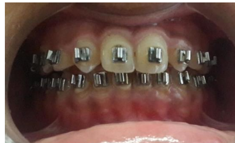
Gambar 5. Tampak depan pada akhir tahap III perawatan