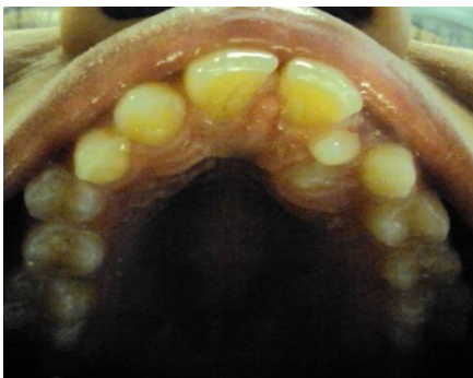
Gambar 2. Tampak oklusal sebelum perawatan

dan gigi 43 dan 33 serta penggunaan karet elastik intermaksiler klas II 5/16 " 2 Oz. Stopper dibuat pada sisi distal braket gigi 21 untuk mencegah pergeseran kearah distal dan sebagai kaitan ligatur pada archwire (Gambar 2) Setelah perawatan 4 minggu, button dipasang dan kawat ligatur diikatkan archwire dan diaktifkan dengan memilin kawat sehingga memberi gaya tarikkan ke arah lengkung gigi pada gigi kaninus yang impaksi. Penggunaan button yang direkatkan pada permukaan gigi kaninus yang impaksi berfungsi sebagai kaitan untuk menarik gigi pada posisi lengkung gigi yang diharapkan. Kontrol dilakukan 3 minggu sekali untuk koordinasi archwire dan aktifasi atau penggantian kawat ligatur. Setelah 12 minggu perawatan levelling dan unraveling tercapai, archwire diganti dengan plain archwire menggunakan kawat 0,016" baik rahang atas dan rahang bawah. Archwire rahang atas dilengkapi stopper pada sisi distal braket gigi 21 dan cyrcle hook sisi mesial braket gigi kaninus desidui. Tahap ini gigi kaninus impaksi telah bergeser lebih ke arah labial sehingga button dilepas digantikan braket, sehingga archwire