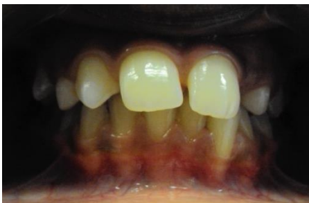
Gambar 4. Tampak Depan, sebelum perawatan