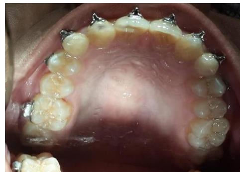
Gambar 3. Tampak oklusal pada akhir tahap III perawatan