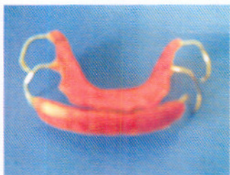
Gambar 2a,b. Lip bumper rahang atas dan rahang bawah