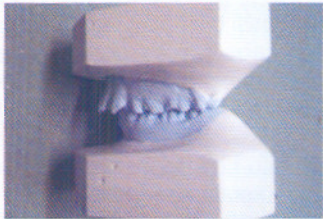
Gambar 1a,b. Studi model tampak dari depan dan samping