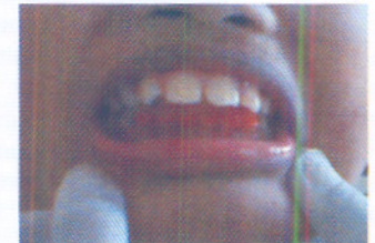
Gambar 3a,b. Insersi Lip bumper rahang atas dan rahang bawah