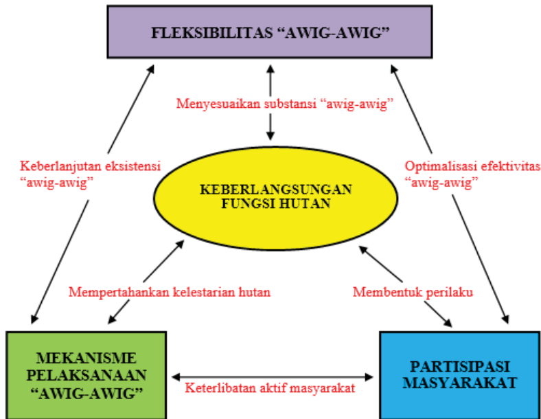
Gambar 2. Hubungan Interelasi Antar Tiap Konsep (Sumber: Hasil Analisis, 2010)

mempengaruhi satu sama lain. Model hubungan interelasi antar tiap-tiap konsep tersebut dapat dibangun seperti Gambar 2 berikut ini.