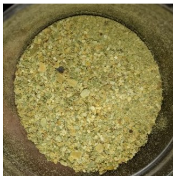
Gambar 1. Hasil simplisia kulit mangga manalagi