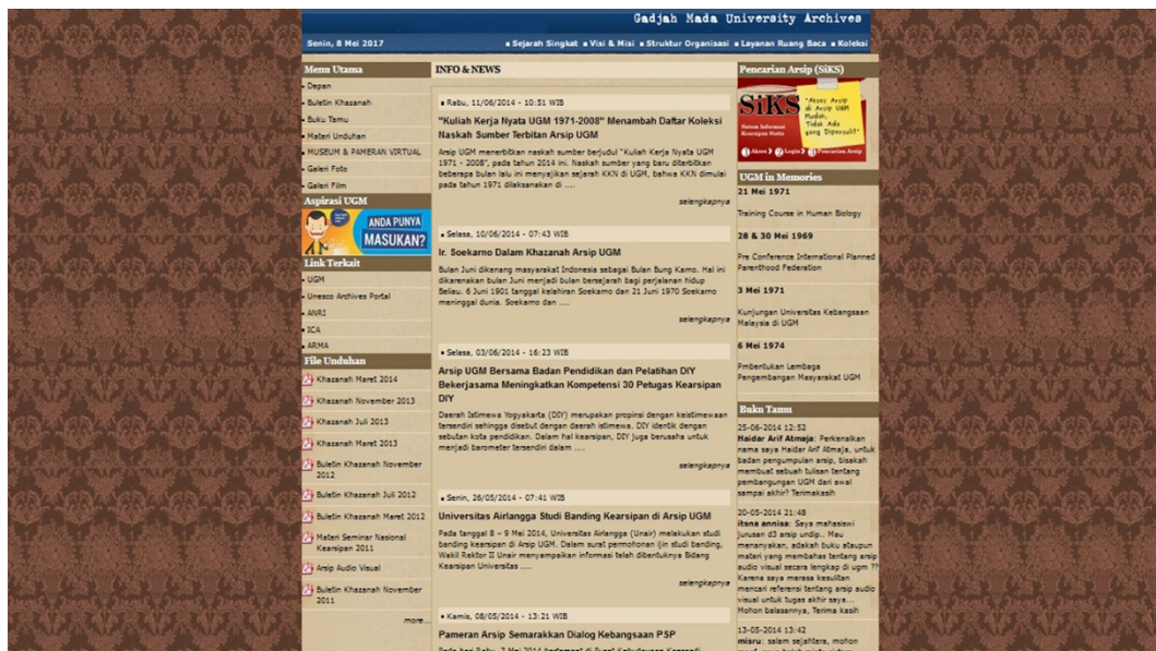
Gambar 7. Khazanah di Laman lama Arsip UGM

menjadi relasi Arsip UGM. Penyebaran Khazanah cetak menggunakan jasa pos untuk eksternal UGM, sedangkan internal UGM dikirimkan oleh petugas ekspedisi dan jasa pengiriman Gama Logistik UGM. Meskipun Khazanah belum diterbitkan secara online akan tetapi format PDF Khazanah sudah upload di laman Arsip UGM www.arsip.ugm.ac.id sejak tahun 2011 sehingga dapat diakses secara online oleh masyarakat luas.