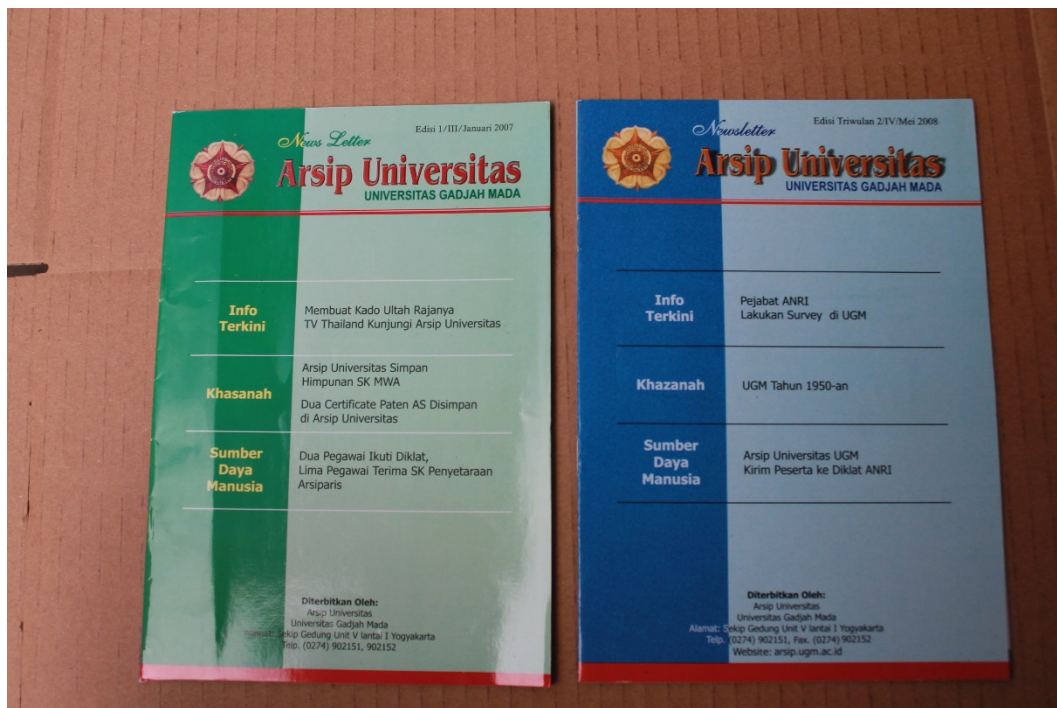
Gambar 2. News Letter bentuk buku (edisi pertama Januari 2007 dan terakhir Mei 2008

Tahun 2007 Arsip UGM mengajukan ijin ke PDII LIPI untuk mengembangkan News Letter menjadi Jurnal. PDII LIPI menyetujui permohonan pengembangan News Letter menjadi jurnal dengan nama “Khazanah: Jurnal Pengembangan Kearsipan” dengan nomor ISSN 1978-4880. Ijin PDII LIPI tersebut kemudian ditindaklanjuti dengan menerbitkan media publikasi pengganti News Letter .