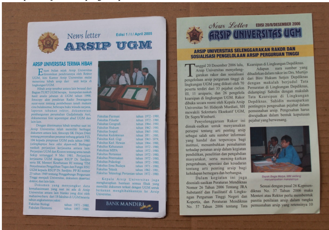
Gambar 1. News Letter 2 lembar edisi pertama April 2005 dan Edisi terakhir Desember 2006.

Khazanah: Jurnal Pengembangan Kearsipan merupakan salah satu media publikasi kearsipan yang dikembangkan oleh Arsip UGM. Media publikasi ini merupakan pengembangan dari News Letter yang diterbitkan Arsip UGM sejak April 2005 yang terbit tiap bulan hanya berupa 1 lembar kertas 4 halaman. News Letter dalam format ini terakhir diterbitkan pada Desember 2006. Januari 2007 News Letter diubah tampilannya menjadi buku mini dicetak berwarna dengan jumlah halaman lebih dari 4 halaman. News Letter dengan format ini terbit hingga Mei 2008.