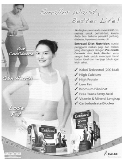
Gambar 6. Penggunaan Bahasa Inggris sebagai Headline Iklan Susu Merk Entrasol (Sumber: Majalah Kartini , Edisi 3 Agustus-6 September 2007, Halaman 74).

Gambar 5 dan 6 di atas adalah beberapa contoh hegemoni penggunaan Bahasa Inggris dalam iklan di media massa Indonesia kontemporer. Penggunaan bahasa Inggris dalam konteks kedua iklan tersebut di atas mempunyai daya tarik kuat karena difungsikan sebagai headline . Pada gambar 5, untuk iklan obat sakit mag merk