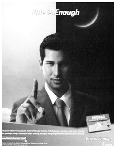
Gambar 5. Penggunaan Bahasa Inggris sebagai Headline Iklan Obat Sakit Mag Merk Promag (Sumber: Majalah Tempo , Edisi 30 Maret-5 April 2009, Halaman 49).