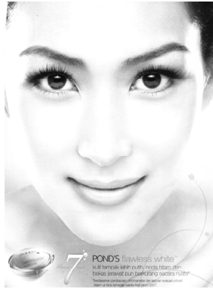
Gambar 4. Iklan Kosmetik Pemutih Kulit, Produksi Luar Negeri, Merk Pond's (Sumber: Majalah Femina , Edisi 20-26 Desember 2007, Halaman 31).

Gambar 3 dan 4 tersebut di atas adalah representasi iklan untuk kosmetik pemutih kulit yang diproduksi di dalam negeri, yakni merk Viva White (gambar 3) dan produk asing yang bermerk Pond's (gambar 4). Fenomena kulit putih, yang notabene khas Barat itu, kini dianggap sebagai standar ideal yang menghegemoni kesadaran bangsa-bangsa Timur, termasuk Indonesia sehingga menggeser mainstream wacana warna kulit bangsa Timur yang telah mengideologi ribuan tahun lamanya, yakni sebagai bangsa yang berkulit misalnya sawo matang, kuning langsung, coklat, kuning, atau hitam.