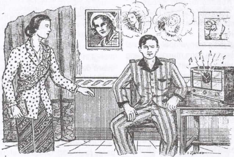
Ilustrasi 3: (Suara) radio dalam DTGR yang digambarkan telah menimbulkan kebingungan dan perang batin dalam diri Amir: antara yang profan dan religius, antara tradisi dan modernitas, antara Anna, gadis Sunda yang 'modern' dan pintar menyanyi keroncong dan Sitti Fatimah Darwisj, gadis Minang yang Islami, terpelajar dan pintar baca al-Qur'an (Dimiyati [1940]: 53)

DTGR menggambarkan daya tarik baru mechanical sounds di akhir era kolonial di Hindia Belanda—suara yang mengandung gengsi karena merepresentasikan modernitas. Ada yang meresepsinya dengan gairah dan, sebaliknya, ada yang menganggapnya sebagai noise , 'polusi' dan malah acaman. Mendengarnya berbahaya, mencemarkan jiwa, merusak