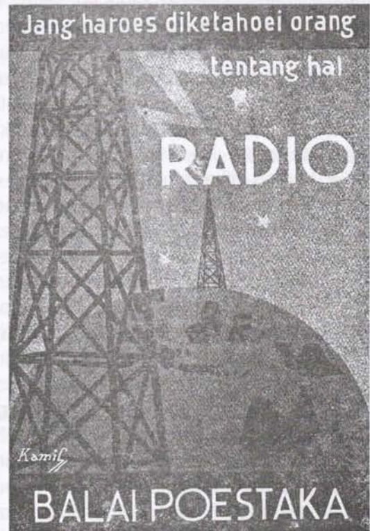
Ilustrasi 2: Terjemahan buku Kostyurin (1932) oleh Armijn Pan(1937), buku pertama tentang radio dalam Bahasa Melayu ("Baroe satoe ini boekoe radio bahasa Melajoe")

bahkan mambatja soerat kabar sadja djoega soedah merasa malas, sebab tentang perkabaran-perkabaran dalam soerat kabar orang bisa mendengar dari radio" (Soç, 1939:65).