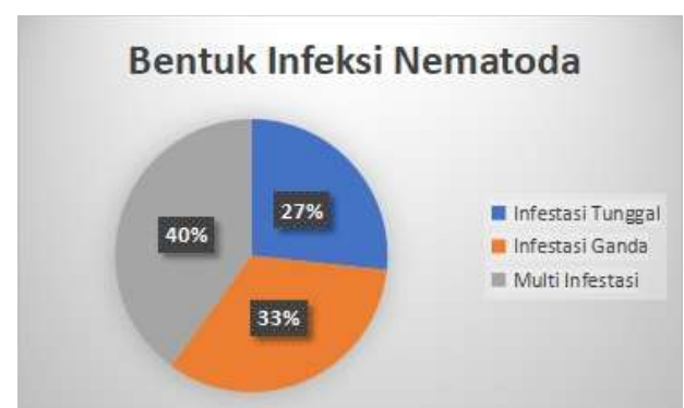
Gambar 2. Persentase Bentuk Infeksi Nematoda pada Sapi Perah di Tegalombo, Pacitan

Hasil pemeriksaan telur cacing dengan metode Mc Master didapatkan jumlah telur nematoda sebelum pengobatan atau pada hari ke 0 berkisar antara 66-800 EPG. Menurut Taylor et al. (2016), derajat keparahan infestasi cacing pada sapi dibagi menjadi 3, yakni: a) Infestasi ringan: \leq 100 butir/gram feses; b) Infestasi sedang: 200-700 butir/gram feses; dan c) Infestasi berat: \geq 700 butir/gram feses. Berdasar kriteria tersebut, pada penelitian ini terdapat 1 ekor yang statusnya terinfeksi berat, sedangkan lainnya terinfeksi ringan-sedang (Tabel 3). Menurut Al-Aliyya et al. (2022) sapi yang terinfeksi berat kemungkinan mengalami