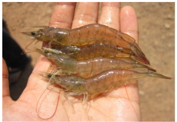
Gambar 3. Lokasi pemantauan di tarakan dan sampel udang windu ( Penaeusmonodon )