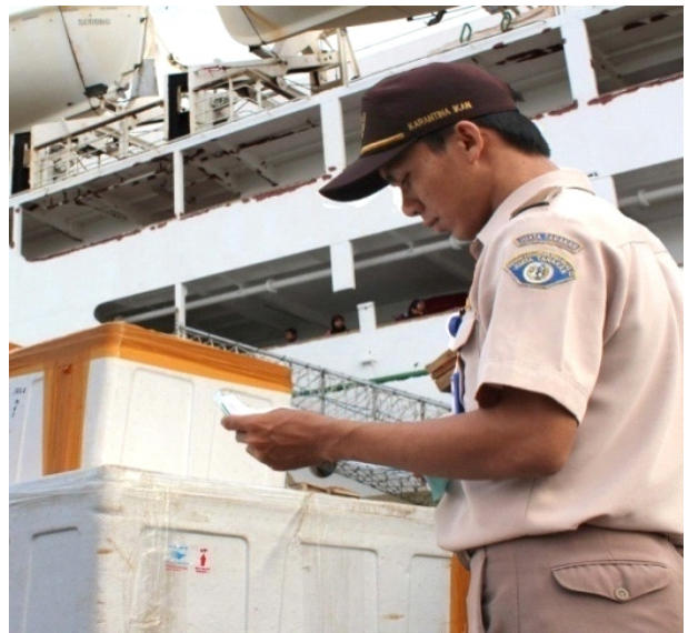
Gambar 2. Aktifitas sosialisasi kepada para pelaku bisnis dan petambak udang yang ada di Tarakan