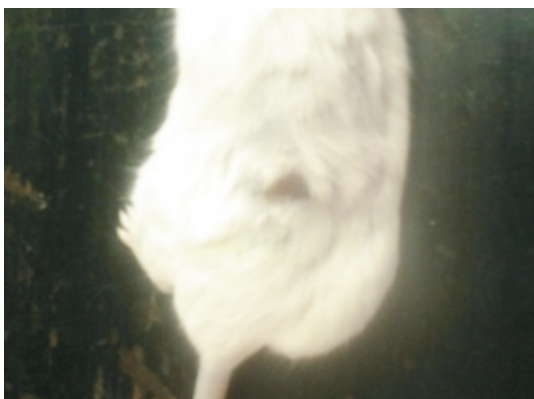
(c) kelompok perlakuan hari ke-4