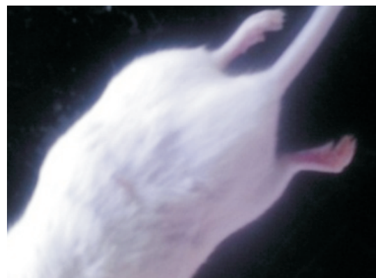
(d) kelompok perlakuan hari ke-7