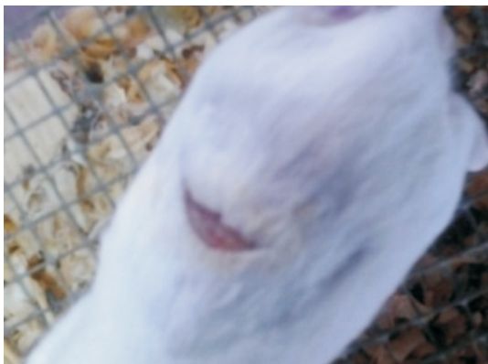
(a) Kelompok kontrol hari ke-4

Data berupa penyempitan area insisi karena proses epitelisasi dan jumlah fibroblast pada pengamatan preparat histopatologi pada hari ke-4 dan ke-7 ditabulasikan dan kemudian dianalisis secara statistik. Data dianalisis menggunakan program SPSS 21 dengan uji one way analysis of variance (ANOVA) dilanjutkan dengan uji least significance difference (LSD).