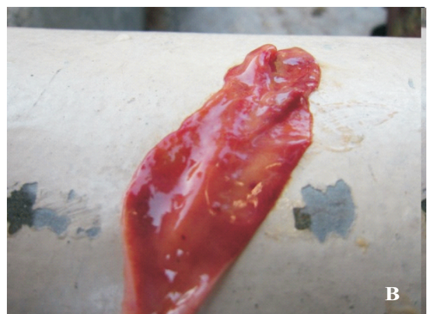
Gambar 1. Nekrosis hemoragik pada proventrikulus (A) dan usus halus (B)