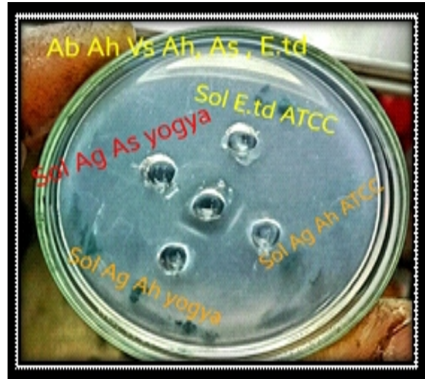
Gambar 1. Uji AGP menunjukkan reaksi positif dan negatif : Ab O A. hydrophila Vs A. hydrophila (positif), A. hydrophila ATCC 35654 (kontrol positif), A. salmonicida (negatif) tidak adanya garis presipitasi, E. tarda ATCC 15947 (kontrol negatif).

Garis presipitasi mulai terbentuk dengan kontrol positif setelah 12 jam pengamatan, dan setelah 4 hari inkubasi tidak ada reaksi presipitasi pada kontrol negatif. Hasil pengamatan menunjukkan bahwa tidak ada cross reaksi ( false + ) atau false - ) pada tes AGP menggunakan antiserum A. hydrophila . Ketika diuji sendiri, kedua antiserum juga memberikan hasil yang sama seperti tampak dalam gambar di bawah (Gambar 3, 4).