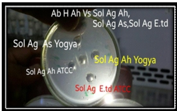
Gambar 4. Uji AGP : Ab H A. hydrophila Vs Sol Ag A. hydrophila isolat Yogya, A. hidrophila ATCC 35654 (kontrol positif) hasil positif ditunjukkan dengan adanya garis presipitasi.

Uji AGP spesifik dan sensitif untuk mendeteksi antigen terlarut A. hydrophila . Disamping lebih baik jika dibandingkan dengan uji biokemis, uji AGP mempunyai beberapa keunggulan lain pada identifikasi pada penyakit ikan yang pathogen. Hanya dengan menggunakan satu plate agar, multiple Ag dapat diuji secara bersamaan (simultan), hal ini dikatakan oleh Garvey (1977). Metode ini juga dapat mengeliminasi cross reaksi, auto-aglutinasi, yang biasanya terjadi pada rapid slide agglutination .