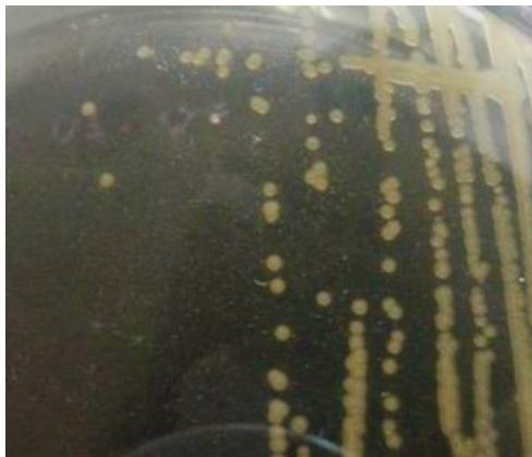
Gambar 1. Koloni bakteri umur 4 hari hasil isolasi dari sampel sakit di atas medium periwinkle wilt

Hasil pengujian patogenisitas isolat bakteri patogen yang diuji mampu menginfeksi tanaman cengkeh dengan gejala daun yang menguning, kering lalu berguguran. Hal ini menunjukkan isolat bakteri tersebut merupakan ciri dari gejala bakteri penyebab penyakit Sumatera ( R. syzygii ) (Semangun, 2000). Gejala penyakit muncul dengan ditandai daun menguning dan kering setelah 28 hari setelah inokulasi (HSI) dan daun berguguran hingga keseluruhan daun tidak ada lagi pada tanaman