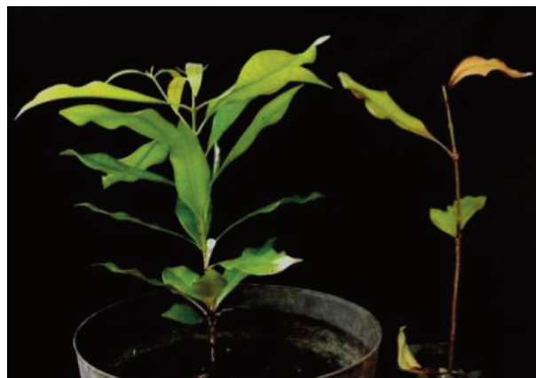
Gambar 3. Bibit cengkeh kontrol (kiri) dan yang diinokulasi bakteri uji (kanan) pada 57 HSI