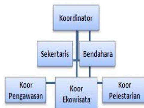
Gambar. 2. Struktur Organisasi Gemuruh

Pembentukan struktur organisasi dalam gerakan sosial sangat diperlukan. Hal ini dikarenakan gerakan sosial mudah mengalami kegagalan. Sehingga dengan adanya akan menjaga eksistensi dari organisasi gerakan sosial itu sendiri agar dapat eksis dalam memperjuangkan gerakan penyelamatan lingkungan yang telah banyak mengalami kerusakan. Kusumah (2015: 237) menjelaskan pelebagaan atau institusionalisasi adalah sebuah konsep sosiologi untuk menjelaskan bahwa sesuatu telah menjadi bagian dari dunia sosial. Begitu pula dengan Gemuruh yang mempunyai struktur organisasi sebagai respon terhadap kelangkaan SDKP yang terjadi di Kecamatan Muncar dan perairan Selat Bali. Struktur organisasi Gemuruh sendiri dapat dilihat pada gambar 2, yang terdiri dari koordinator, sekretaris, bendahara, koordinator pengawasan, koordinator ekowisata dan, koordinator pelestarian.