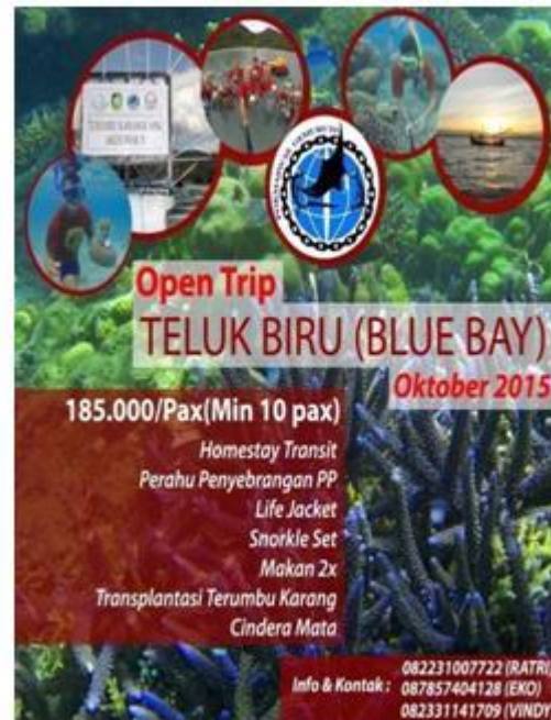
Gambar. 3. Paket Ekowisata Teluk Biru

Pembentukan ekowisata oleh Gemuruh merupakan bentuk dari social-organizational resource dalam kategori social network dalam menjamin tersedianya sumber pendanaan pada organisasi gerakan sosial dalam menjalankan aksinya. Ekowisata Teluk Biru merupakan strategi dalam mendapatkan sumber pendanaan untuk diakumulasikan dalam aksi yang dilakukan oleh Gemuruh .