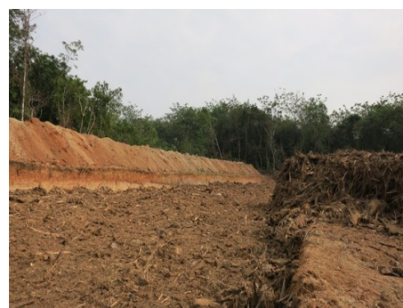
Gambar 4 Lubang untuk pengomposan