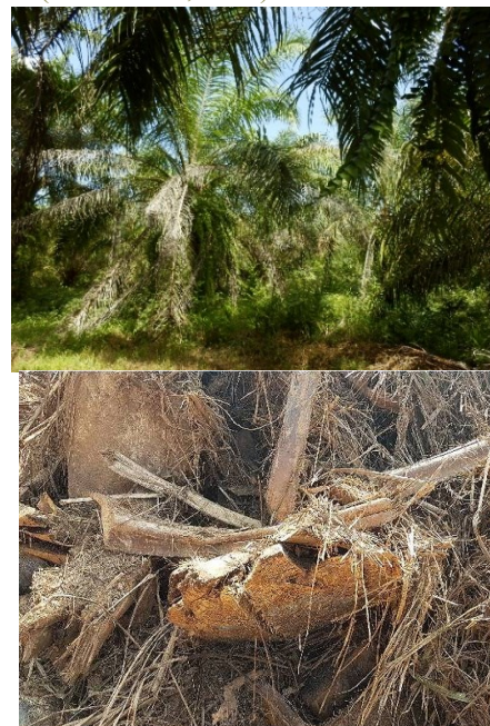
Gambar 1 (a) Tanaman sawit umur 20 tahun sebelum ditebang (b) Biomassa sawit setelah ditebang

untuk membuat papan serat (Agus & Widyorini, 2012) dan sebagai bahan energi, seperti bioetanol (Boateng & Lee, 2014; Hossain & Jalil, 2015). Akan tetapi, limbah tebangan kelapa sawit yang dimanfaatkan untuk pembuatan arang ataupun asap cair memerlukan proses karbonisasi. Proses tersebut memerlukan panas atau suhu tinggi sehingga tidak dapat dilakukan di dekat pabrik PTSB karena berbahaya. Adapun pemanfaatan sebagai papan serat memerlukan peralatan dan teknologi tambahan yang cukup mahal apabila hanya diaplikasikan untuk satu kali penggunaan (tidak kontinu). Oleh karena itu, perlu dilakukan alternatif pemanfaatan lain yang berbiaya rendah dan hasilnya memiliki kemanfaatan yang besar bagi masyarakat. Salah satu alternatif tersebut adalah dengan mengolah limbah biomassa sawit menjadi kompos (Bulan et al., 2016).