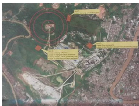
Gambar 2 Peta lokasi Pabrik PT Semen Baturaja (Persero) Tbk dan lokasi pembuatan kompos