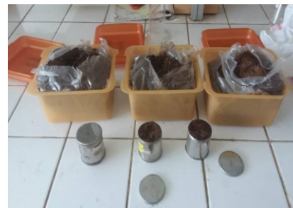
Gambar 6 Spesimen gundukan untuk pengujian kadar air dan berat jenis

Hasil pengamatan fisik menunjukkan warna kompos yang kehitaman dan berbau tanah seperti yang disyaratkan dalam standar. Hasil pengujian rerata kadar air berdasarkan berat basah dari spesimen kompos gundukan 1 menunjukkan 53,65% dan berat jenis berdasarkan metode silinder menunjukkan 0,55. Spesimen pengujian kadar air dan berat jenis disajikan pada Gambar 6.