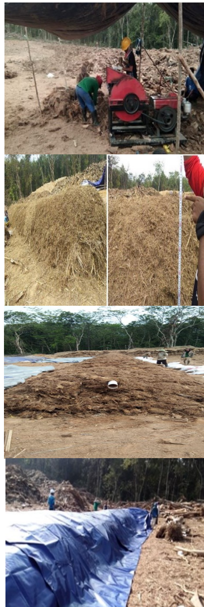
Gambar 3 (a) Proses pengecilan ukuran biomassa; (b) pencampuran biomassa; (c) pemasangan pipa di tengah gundukan; (d) penutupan gundukan dengan terpal (berturut-turut dari posisi kiri atas berputar searah jarum jam)

3d). Adapun biomassa yang berupa batang dan pekapah yang sangat keras diolah menjadi kompos dengan metode penimbunan ( graveyard ) (Gambar 4). Alur pembuatan kompos secara lengkap dirangkum dalam flowcard pada Gambar 5.