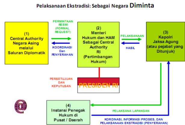
Bagan 2. Pelaksanaan Ekstradisi Sebagai Negara Diminta ( Requested State )