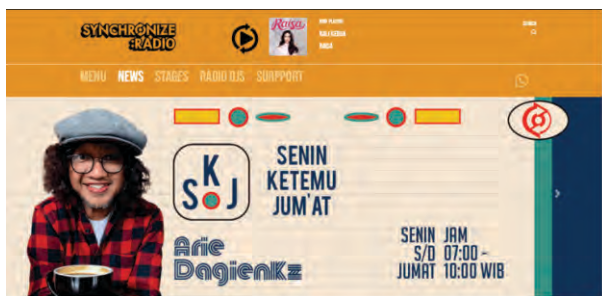
Gambar 1. Tampilan web Synchronize Radio

“Ide bikin radio dari 2017 jadi sebelum pandemi. Kita mikir Synchronize cuma di Jakarta. Jadi radio kita buat untuk ngasih tahu Lebarannya anak-anak musik. Jadi bisa ngerasain suasananya bahwa ini festival beda, bisa merasakan atmosfer yang enak, Feeling itu yang ingin kita sampaikan ke mana-mana.”(Apriludy, 2021).