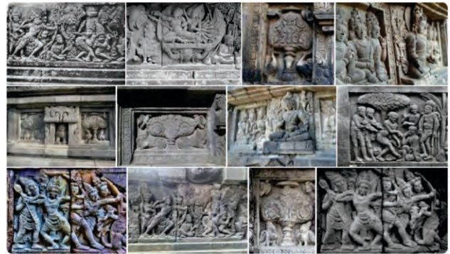
Gambar 1. Relief Candi Prambanan

Dalam masa modern saat ini (dalam pemaknaan fenoteks) semiotika atau simbolisasi fisik wanita, muncul dalam berbagai kegiatan sebagai objek, fisik wanita tidak hanya menjadi komoditas seksual, tetapi lebih dari itu adalah menjadi komoditi untuk dunia usaha. Fisik yang indah, putih dengan bentuk dada yang menurut sebagian orang sangat bagus, dieksploitasi hanya untuk memenuhi kebutuhan kapitalis. J.F. Lyotard (Soedjono, 2015) menyebutkan bahwa dalam sebuah sistem ekonomi libido, sebuah betis yang terbuka, payudara yang tersingkap, sebuah paha yang diekspos dianggap bukan sebagai bentuk degradasi moral melainkan sebuah nilai jual dan currency . Artinya disini, wanita siapa saja dan dimana saja dapat mewujudkan fantasi- fantasi yang bebas dengan fisiknya sehingga menjadi sebuah nilai jual. Apakah ini sebuah makna emansipasi modern? Persepsi masyarakat akan menjawabnya.