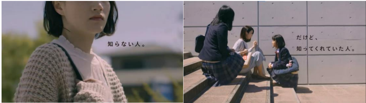
Gambar 1. Dua orang siswi menghampiri pengguna help mark yang tiba-tiba terduduk lemas

Iklan tersebut mengedukasi tentang penggunaan Help Mark bagi orang yang memakainya dan apa yang harus dilakukan oleh orang yang ada di sekitarnya. Menurut laman asli pemerintahan Tokyo, Help Mark adalah “tanda bagi orang-orang yang membutuhkan dukungan dan perhatian khusus, dengan tujuan agar diketahui oleh orang yang berada di sekitarnya. Help Mark berbentuk segiempat dengan simbol plus dan simbol hati yang digantungkan pada tas pengguna. Sasaran dari Help Mark adalah orang yang memakai kaki palsu atau pengganti sendi, orang dengan penyakit dalam atau penyakit berat, ibu hamil trimester pertama dan lainnya yang membutuhkan dukungan dan perhatian khusus, sehingga membutuhkan tanda tersebut.”