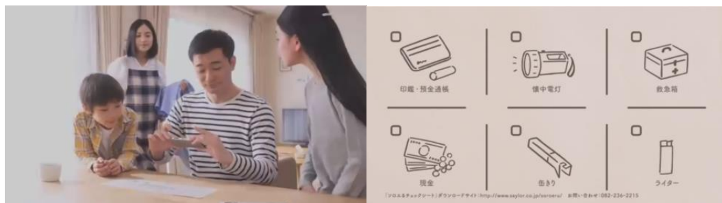
Gambar 5. Keluarga yang sedang memperhatikan persiapan bencana alam

“lembar periksa persiapan bencana” yang dipakai sekarang