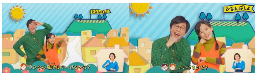
Gambar 3. Pria dan anak perempuan mengamati tempat evakuasi