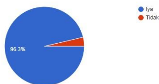
Gambar 2. Penggunaan Budaya Pop Korea saat Belajar Bahasa Korea

Apakah Anda menggunakan budaya pop Korea untuk belajar Bahasa Korea? 27 responses