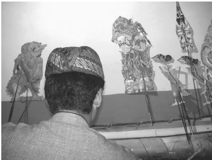
Gambar 1. Kitab Sucineng Manungsa , oleh Purjadi, Bodesari; Bathara Guru (tengah) berkonsultasi pada patihnya Bathara Narada (kiri).

jika ia dapat mengalahkan kesatria tersebut. Cungkring menghadapi sang kesatria, yang menanyakan kitab suci sejati. Cungkring menjawabnya dengan mengatakan bahwa pertanyaan ini tak jelas. Kita harus mengetahui apakah kepercayaan religius yang dianut oleh manusia terlebih dulu. Untuk umat Islam, kitab sucinya Qur'an. Untuk umat Kristiani, Injil. Untuk umat Hindu, Veda. Untuk umat Yahudi, Taurat. Sang kesatria menyanggah. Teks untuk suatu agama tak bisa dipahami kecuali kita memahami bahasa yang digunakan untuk menulisnya. Sebagai contoh, untuk memahami makna Qur'an, kita harus bisa membaca bahasa Arab. Sang kesatria bersikeras akan adanya suatu kitab suci yang dapat dipahami oleh setiap manusia tanpa pandang bahasa ataupun agamanya, termasuk bagi mereka yang tak memiliki agama. Cungkring yang tak mampu menjawab,