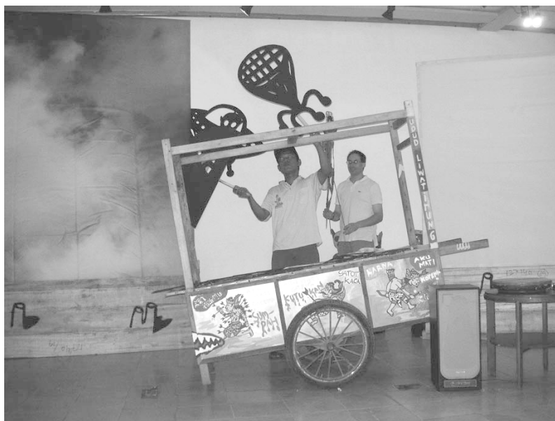
Gambar 3. Latihan untuk Berlian Ajaib, Cemeti Art House, Yogyakarta.