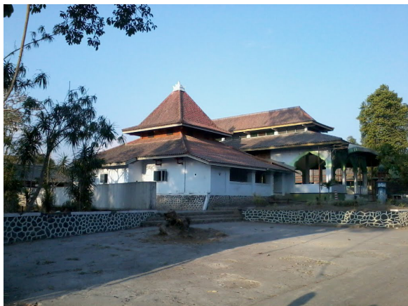
Gambar 4. Bangunan utama masjid Pesantren Pabelan dengan serambinya

Telah dibahas pada bab sebelumnya tentang masjid Pesantren Pabelan, yang dibangun pada 1820 M menjadi bangunan pertama pesantren yang masih bertahan hingga kini. Meski mengalami banyak perubahan pada beberapa bagian dikarenakan perombakan pada 1913 M dan 1995 M, namun bangunan utama dari masjid ini tetap dipertahankan. Seperti dipaparkan pada pembahasan sebelumnya, masjid ini tampak menarik karena bergaya Tradisional Jawa Kuno di antara bangunan-bangunan lain yang terlihat modern di dalam kompleks pesantren.