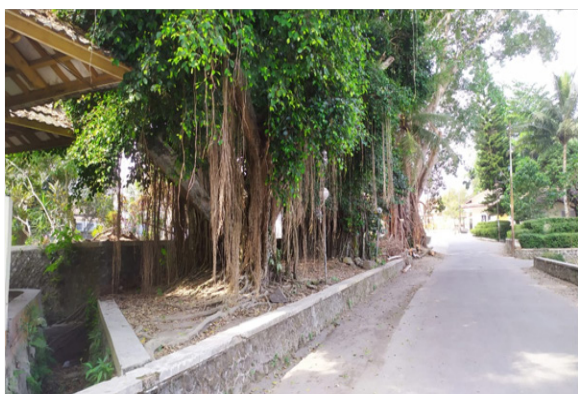
Gambar 10. Jalan masuk utama yang bersebelahan dengan area pemakaman yang dipenuhi pohon-pohon besar.

Penjagaan lingkungan alam ini dapat dikatakan berhasil. Hal ini juga dibuktikan dengan penghargaan Kalpataru pada tahun 1982 yang diterima Pesantren Pabelan. Pelestarian lingkungan alami ini juga memberikan pasokan udara bersih bagi lingkungan pesantren. Ini dimanfaatkan betul lewat bangunan seperti perpustakaan yang menggunakan sistem penghawaan alami dan pencahayaan alami.