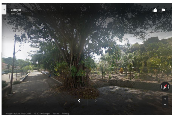
Gambar 4. Area Pemakaman dengan jalan masuk utama di sisi selatannya

Area Pemakaman di Pesantren Pabelan bukan terletak di pinggir kompleks pesantren, melainkan berada di tengah-tengah kompleks. Sisi dalam area pemakaman hampir selalu terlihat dari luar, terutama dari sisi selatan dan timur. Jika memasuki area pesantren melalui jalur utama, maka akan melewati sisi selatan area pemakaman. Sisi dalam area pemakaman juga terlihat jelas dari dalam masjid melalui jendela di bagian barat.