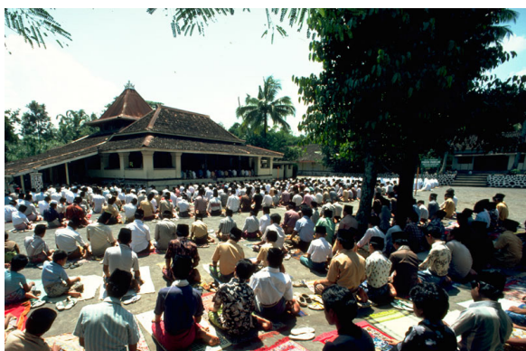
Gambar 8. Masjid Pesantren Pabelan dan santri yang sedang shalat berjamaah.

Kubah sendiri memiliki sejarah panjang yang awalnya sama sekali tak berkaitan dengan Islam. Kubah pertama yang tercatat dibangun tak lama sesudah kebakaran besar di Roma pada tahun 64 M, di Domus Aurea yang terletak di lereng gunung Palatine, sedangkan kubah sebagai sebuah bagian dari masjid baru tercatat paling tidak sekitar abad ke-12. Kemudian masjid