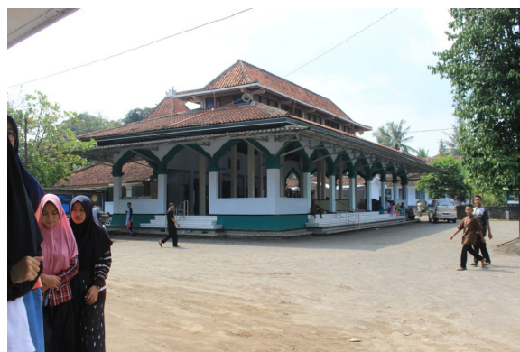
Gambar 6. Serambi masjid Pesantren Pabelan

Jika membaca pada banyak kajian tentang perancangan masjid di berbagai negara, akan didapati berbagai variasi