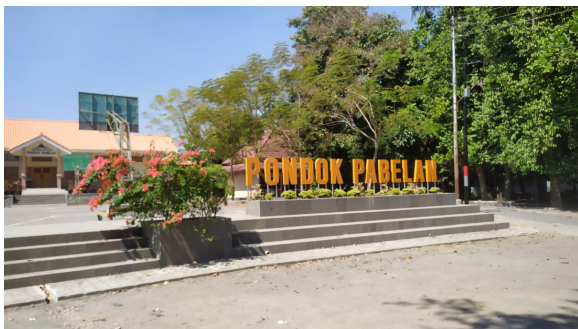
Gambar 9. Lingkungan Pesantren Pabelan yang dipenuhi pepohonan.

Danang (2018) bercerita bahwa Pesantren Pabelan memiliki sebuah aturan, jika satu pohon besar ditebang untuk diambil manfaatnya, maka harus ada 3 bibit pohon baru ditanam untuk penggantinya. Hingga saat ini aturan tersebut masih dipertahankan. Dapat dilihat implikasi dari aturan tersebut, lingkungan Pesantren Pabelan masih dipenuhi dengan banyak pohon besar.