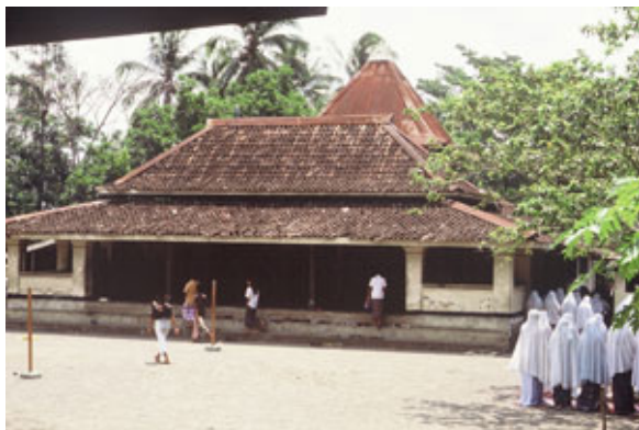
Gambar 7. Serambi Masjid sebelum mengalami rekonstruksi

dipertahankan, dan tidak diubah menjadi masjid seperti kebanyakan yang dapat dijumpai saat ini, dengan kubah, dan banyak ornamen.