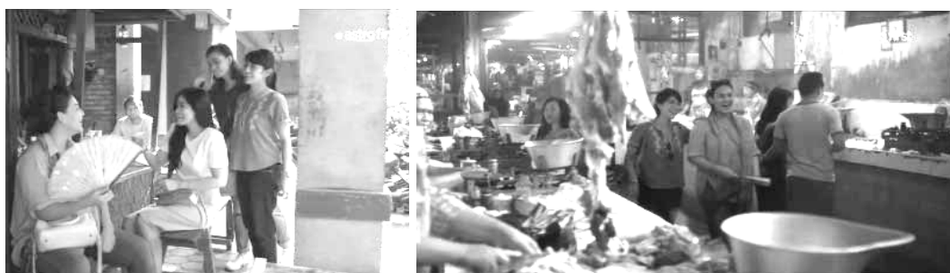
Gambar 06. Tema: Kehidupan sehari-hari Capture timecode 00:24:25 dan 00:23:53

memusatkan cerita pada persoalan cinta. The romance film genre is refers to narratives focusing on wanting love, finding love, losing love or gaining love- and often takes on an examination of the nothion of true love (Selebo,2015:92). Persoalan cinta menjadi hal utama dalam pembahasan sebuah film. Tokoh utama dalam cerita ini adalah sepasang manusia yang saling mengasihi berusaha agar dapat bersama. Oleh karena itu cerita roman lebih bersifat perjuangan dan perjalanan.