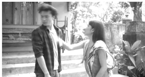
Gambar 05. Cinta dan ketidakadilan Capture timecode 01:00:21

Genre film roman merupakan pengembangan dari genre drama yang