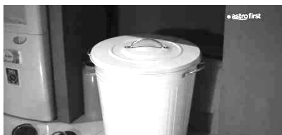
Gambar 10. Tong sampah sebagai tanda cinta yang sangat dalam Capture timecode: 01:46:09