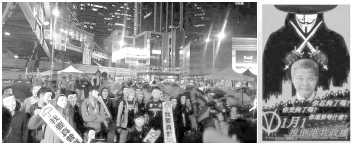
Gambar 2. Pengaruh V for Vendetta dalam Occupy Central di Hongkong, 2014

is a symbol of vengeance against all the injustice happening ”, begitu katanya pada Ahram Online.