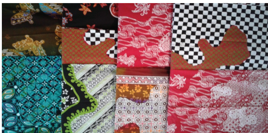
Gambar 1 Warna Motif Batik Giriloyo Kontemporer

Kejenuhan terhadap motif-motif klasik dari konsumen, sehingga membuat para pengusaha dan perajin membikin batik kontemporer, tapi tetap tidak meninggalkan motif klasiknya. Batik kontemporer sendiri merupakan perpaduan antara batik klasik dan batik modern. Para pengusaha dan perajin