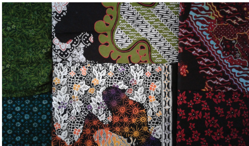
Gambar 2 Batik Kontemporer