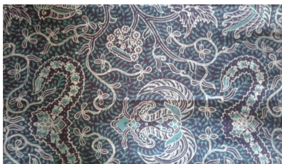
Gambar 4 Motif Wahyu Temurun Improvisasi

pada gambar 4 motif Wahyu Temurun yang memainkan warna oleh para perajin secara suka-suka tanpa ada aturan yang berlaku. Proses transformasi tersebut didapatkan dari pengalaman melihat pameran-pameran. Karena manakala dalam satu kain batik terdapat kerumitan yang tinggi dalam hal membuat, mewarnai, lamanya membatik, maupun variasi motifnya banyak, maka akan berpengaruh juga terhadap harga batik itu juga. Di sini terletak suatu hukum yang berlaku dalam batik tulis bahwa semakin tinggi nilai motif batik tersebut, maka akan semakin tinggi juga nilai jualnya.