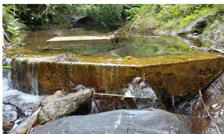
Gambar 2 Salah satu Dawuan (Bendungan) Dan Sisa Sesaji Komunitas Tajakembang

Lahan persawahan merupakan ekosistem terpenting dalam konteks siklus hidro-sosial, yaitu menggabungkan aspek hidrologi dan sosial dalam pengelolaan sumber daya air dan pertanian. Pengelolaan air yang efisien sangat penting untuk memastikan pertumbuhan tanaman padi tumbuh optimal. Komunitas ini memanfaatkan aliran sumber mata air Taja Padaya yang merupakan wilayah hutan lindung di wilayah tersebut. Pembuatan dan pemeliharaan Dawuan atau bendungan kecil sebagai upaya penampungan air dan penyeimbang aliran air dilakukan secara