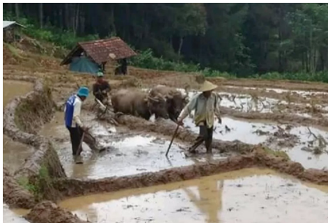
Gambar 3 Pengelolaan Lahan Pertanian Komunitas Adat Tajakembang