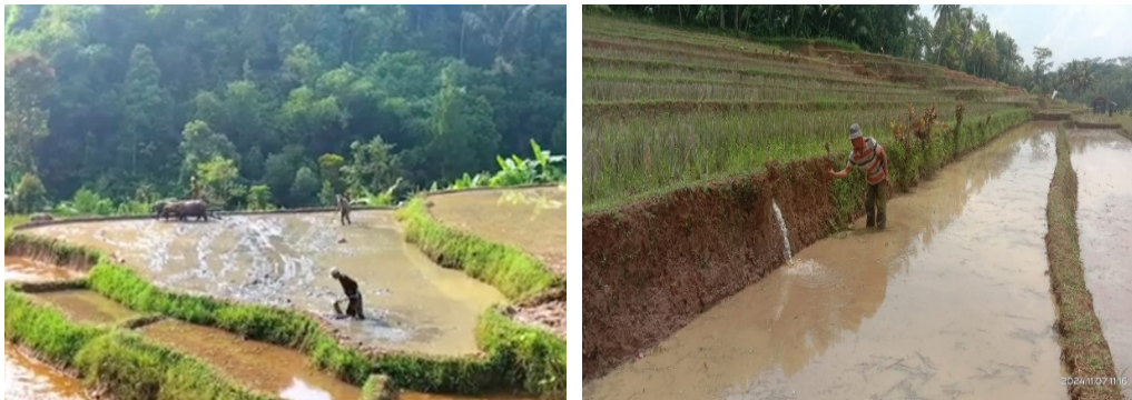
Gambar 4 Pengelolaan Lahan Dilakukan Secara Gotong Royong