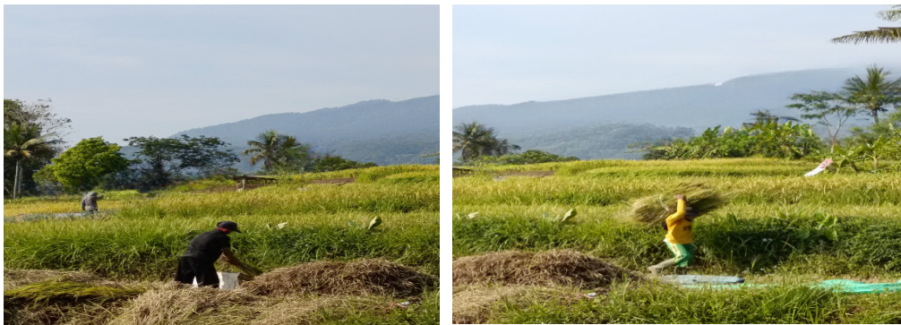
Gambar 5 Sistem Pengolahan Hasil Pertanian Dilakukan Secara Tradisional