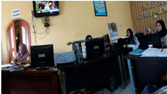
Gambar 3. Tempat Penginputan Data Masyarakat

"...pakai komputer untuk input data masyarakat yang mengajukan..." (I3)