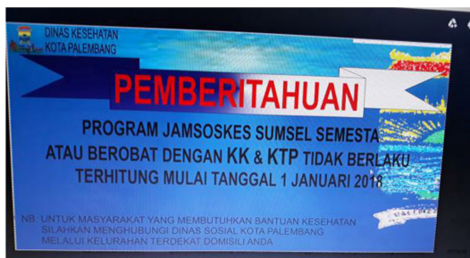
Gambar 4. Template Media Spanduk

"...kalo untuk penyebaran informasi ke masyarakat ado spanduk dari dinkes dek..." (I7)