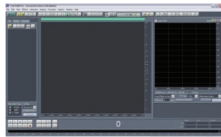
Gambar 3. Software Cool Edit Pro 2.1.

software Cool Edit Pro 2.1 dimulai dengan membuka file suara yang sudah dalam bentuk '.wav'. File suara yang sudah terbuka akan ditampilkan pada kolom besar yang terletak di tengah. Hasil yang ditampilkan kemudian diblok pada rentang daerah yang akan dianalisis, kemudian tekan tombol "analyze" pada toolbar atas dan lanjutkan dengan menekan tombol "show frequency analyze" sampai dikeluarkan grafik hasil analisis suara. Grafik hasil analisis suara memiliki nilai frekuensi dan amplitudo. Nilai frekuensi dapat dilihat dari sumbu horizontal grafik dan nilai amplitudo dapat dilihat dari sumbu vertikal grafik. Terdapat pola yang terjadi pada grafik dan perhatian lebih difokuskan pada pola dengan frekuensi di bawah 5000 Hz. Hasil analisis suara berupa grafik kemudian diprint dan ditandai tiga titik tertinggi dengan rentang frekuensi di bawah 5000 Hz. Ketiga titik tersebut kemudian diukur menggunakan penggaris untuk didapatkan nilai frekuensi pada sumbu x dan amplitudo pada sumbu y, kemudian ketiga titik tertinggi tersebut dijumlahkan dan dirata-rata untuk mendapatkan hasil akhir nilai frekuensi dan amplitudo.