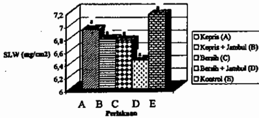
Gambar 3. Berat daun spesifik pucuk tanaman teh (SLW, mg cm -2 ) pada umur 6 bulan dari perlakuan pemangkasan setelah tanaman mengalami cekaman kekeringan