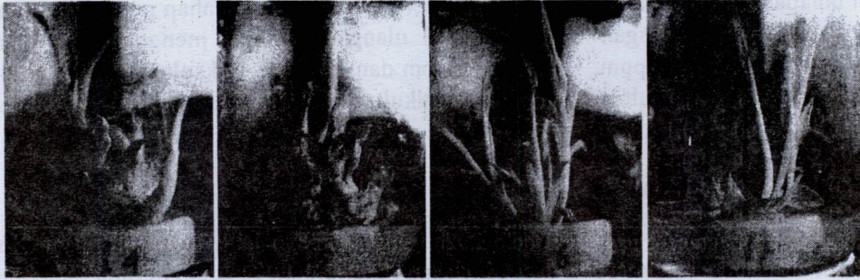
Gambar 2. Pertumbuhan tunas abaka ( Musa textilis Nee) setelah 2 bulan mendapatkan perlakuan BAP 4 ppm ( I_4 ), 5 ppm ( I_5 ), 6 ppm ( I_6 ), dan 7 ppm ( I_7 )

Tunas mikro yang dikulturkan pada media yang diperkaya dengan NAA juga membentuk akar liar. Akar ini tumbuh menyebar pada batang tunas mikro. Semakin tinggi konsentrasi NAA, jumlah akar liar yang terbentuk semakin banyak karena auksin memacu perkembangan akar liar (Salisbury dan Ross, 1995).