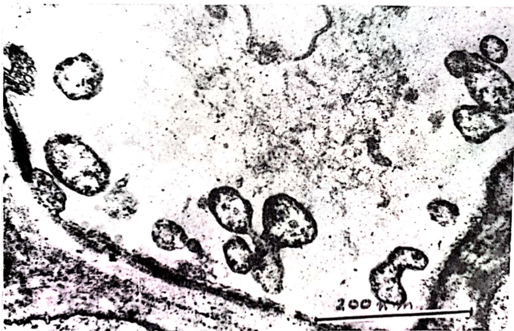
Gambar 3. Organisme seperti Mikoplasma (MLO) dalam Sel Floem Tanaman Sakit.