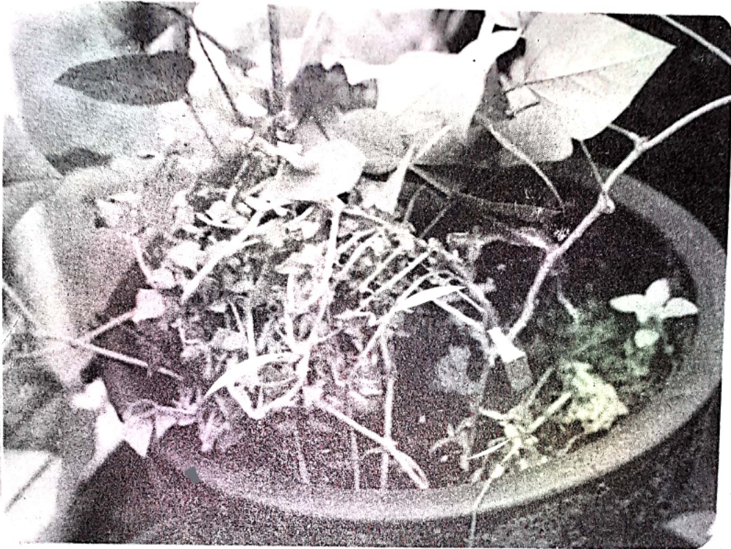
Gambar 2. Gejala Penyakit Sapu pada Kecipir, hasil penularan dengan penyambungan pucuk.