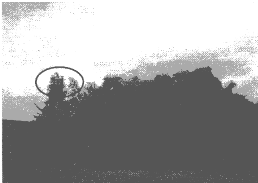
Gambar 3. Peletakan sarang kuntul kerbau

Keterangan: (a) Variabel yang dimasukkan pada tahap ke-1: DBH ( Diameter Breast High / diameter setinggi dada), DTJ (Diameter tajuk), BTT (Bentuk tajuk) BTT1 (Variabel dummy kode 1), BTT2 (variabel dummy kode 2), KTJ (Kerapatan Tajuk), JDG (Jarak dari Gangguan), TP (Tinggi Pohon), TTJ (Tinggi Tajuk).