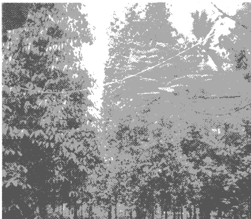
Gambar 2. Ketersediaan pohon melinjo

Tabel 3 menunjukkan bahwa karakteristik yang memiliki perbedaan yang nyata ( p \leq 0,05 ) antara pohon digunakan dengan yang tidak digunakan