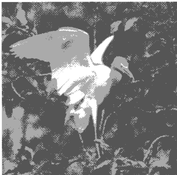
Gambar 5. Potensi wisata fauna di Ketingan

Jika dibandingkan rata-rata kerapatan tajuk pohon yang digunakan dan tidak digunakan menunjukkan perbedaan yang tidak nyata. Dengan kerapatan tajuk yang besar maka kemungkinan gangguan manusia akan berkurang sehingga diduga dengan diameter tajuk yang besar akan menjadikan persentase kerapatan tajuk yang besar. Berdasarkan hal tersebut kemungkinan Kuntul kerbau memilih tempat bersarang karena faktor ini adalah tinggi, tetapi setelah dilakukan analisis regresi logistik menunjukkan tidak ada pengaruh yang nyata terhadap ada tidaknya sarang di pohon.