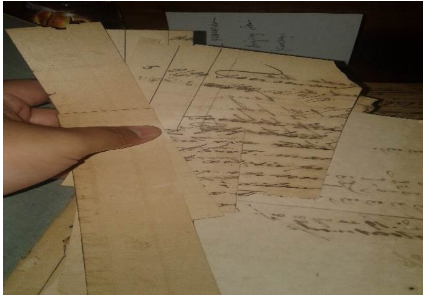
Gambar 3 Bentuk Kerusakan Arsip di Puro Pakualaman

tetap eksis. Hasil penelitian yang dilakukan Risty Styra Nur Novita dkk. (2008) menyebutkan bahwa pengelolaan arsip Puro Pakualaman dilatarbelakangi oleh pemikiran bahwa arsip belum dikelola secara sistematis sehingga banyak arsip yang hilang dan rusak. Selain itu, arsip Puro Pakualaman juga belum dapat dimanfaatkan secara luas. Hal ini disebabkan (Novita dkk., 2008):