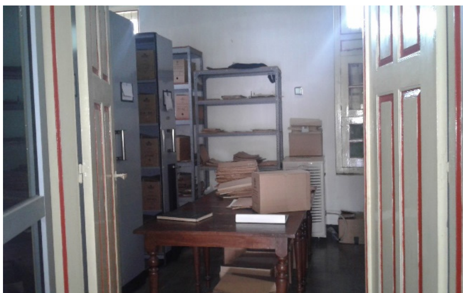
Gambar 2 Ruang Simpan Arsip di Puro Pakualaman

Arsip Puro Pakualaman merupakan aset berharga dan memiliki kontekstualitas tinggi terhadap status keistimewaan Yogyakarta. Oleh karena itu, pelestarian arsip Puro Pakualaman menjadi hal yang mutlak diperlukan agar keistimewaan Yogyakarta