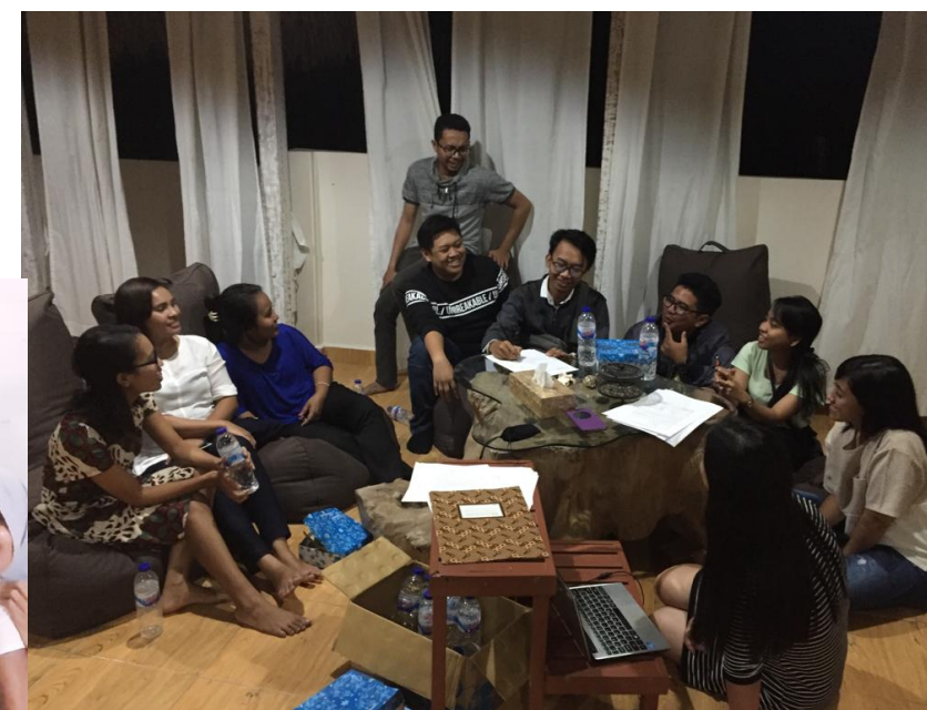
Gb. 3. FGD Sumba

"....Dia tidak mau balik kalau tidak di RS.... Sekarang dia di Alor.... Disuruh kembalikan uang tiga kali lipat." (Sumba 3P).