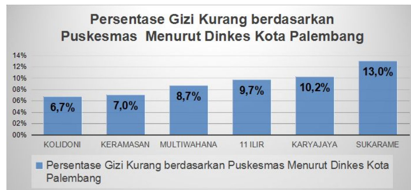
Tabel 1. Prevalensi Gizi Kurang tahun 2016

Masalah gizi kurang dan kinerja program perbaikan gizi masyarakat di Provinsi Sumatera Selatan tahun 2016, berdasarkan data Dinkes Kota Palembang tercatat bahwa :