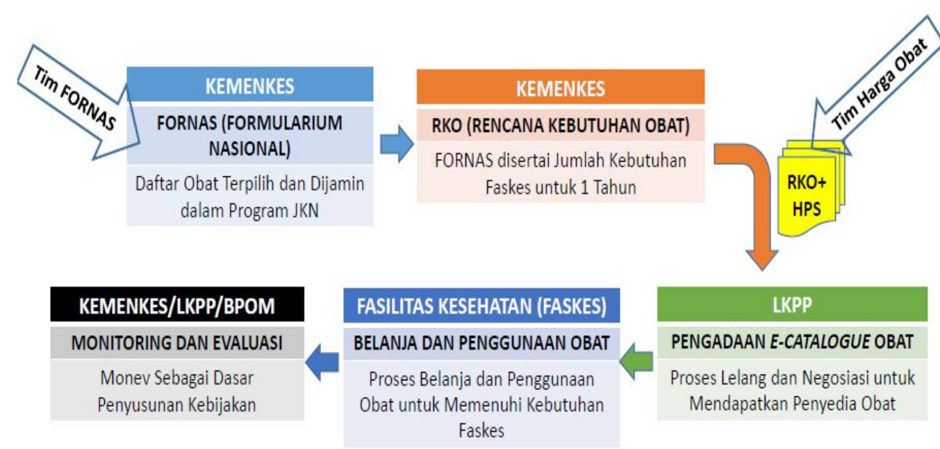
Gambar 1. Tata Kelola Obat dalam JKN

Belum semua satuan kerja di bidang kesehatan melaporkan RKO kepada Kementerian Kesehatan. Menurut data Direktorat Jenderal Kefarmasian dan Alat Kesehatan selama tahun 2017, satuan kerja baik pemerintah dan swasta yang belum melaporkan RKO sebanyak 1387 atau 46,23% dari total seluruh satuan kerja. Selama tahun 2018, satuan kerja baik pemerintah dan swasta yang belum melaporkan RKO sebanyak 884 atau 28,31% dari total seluruh satuan kerja.