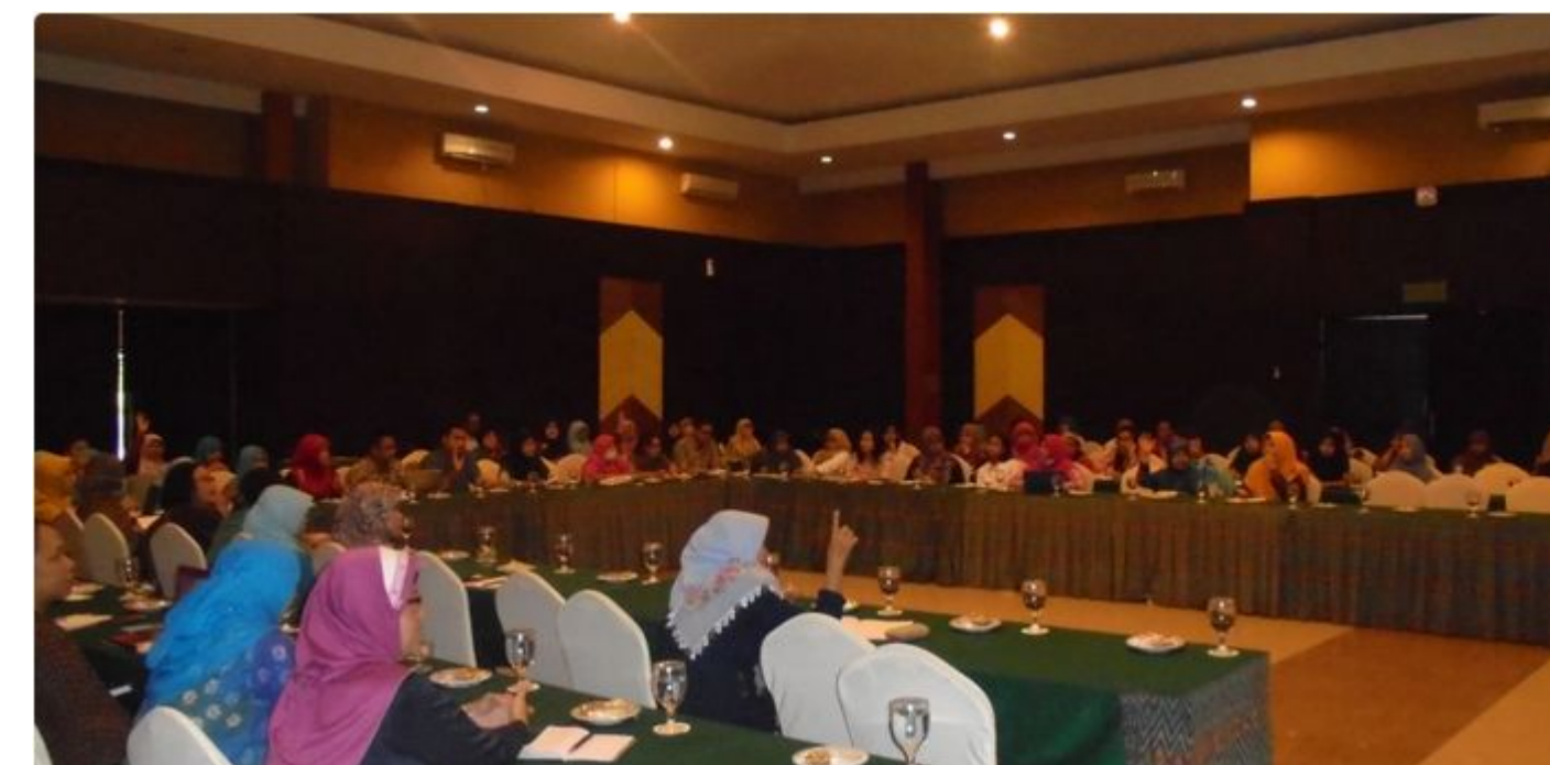
Gambar 4. Sosialisasi e-Monev Katalog Obat dalam Mendukung Perencanaan Kebutuhan Obat (RKO) dan SIPNAP untuk Unit Layanan di DIY pada bulan Agustus 2017.

Dari alur di atas, terlihat bahwa pelaporan realisasi belanja obat melalui e-monev dilakukan dalam aplikasi terpisah dari pelaksanaan belanja obat e-catalogue. Sehingga dapat dikatakan bahwa, keberhasilan implementasi e-monev sangat tergantung kepada komitmen satker dalam melaporkan secara berkala.