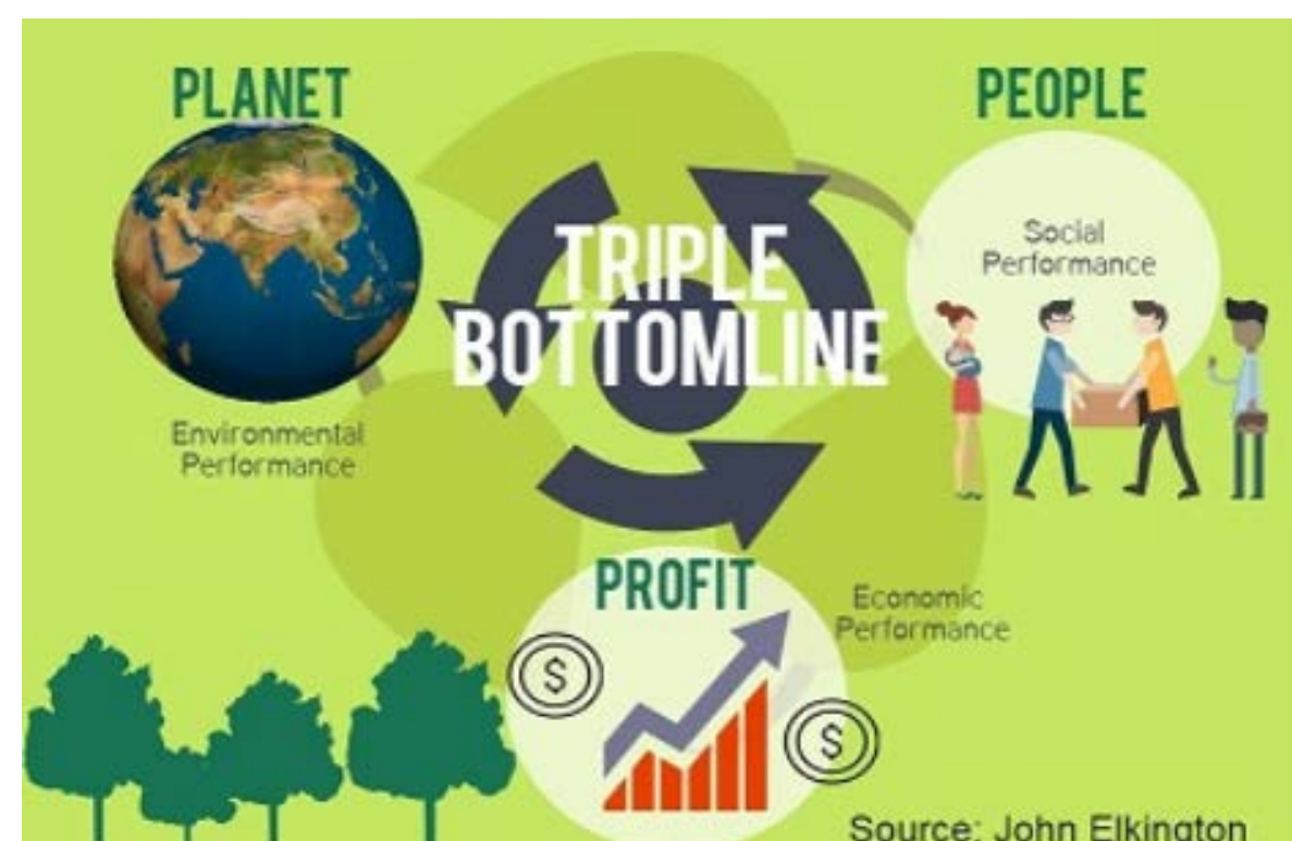
Figure I. The Triple Bottom Line

Sumber : The Triple Bottom Line in 21st Century Business (1988), karya John Elkington