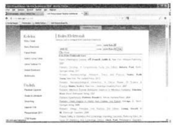
Gambar, 1 Halaman Depan Koleksi Buku Digital

Koleksi buku digital Unit Perpustakaan FK UGM sampai tahun 2012 berjumlah 6.845 judul. Akses koleksi buku digital hanya dapat dilakukan dari lingkungan FK UGM melalui fasilitas intranet. Adapun alamat web untuk akses koleksi buku digital adalah infolib.med.ugm. Mahasiswa FK UGM untuk bisa mengakses koleksi buku digital dengan cara memasukan nomor ID yang diambil dari nomor kartu anggota perpustakaan. Mahasiswa untuk dapat memanfaatkan koleksi buku digital harus menjadi anggota Unit Perpustakaan FK UGM.