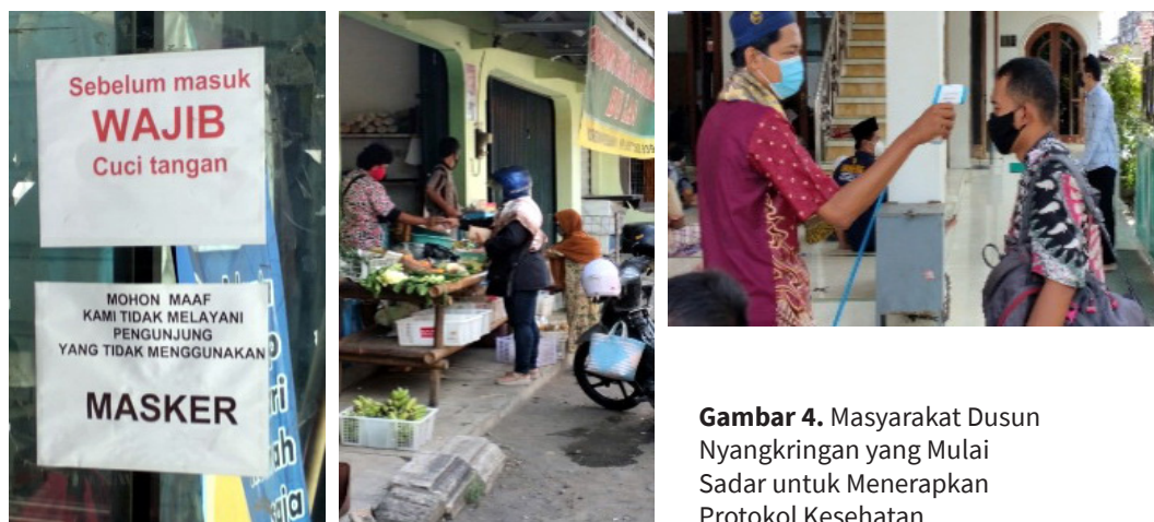
Gambar 4. Masyarakat Dusun Nyangkringan yang Mulai Sadar untuk Menerapkan Protokol Kesehatan

Dengan penyelenggaraan pengabdian kepada masyarakat yang di dalamnya sejumlah peserta dimotivasi untuk dapat meningkatkan kemampuan penggunaan bahasa yang tepat dan mendesain media luar ruang yang persuasif, tampak adanya perubahan perilaku anggota masyarakat yang cukup signifikan. Mulanya banyak anggota masyarakat yang abai terhadap protokol kesehatan dan bahayanya terjangkit Covid-19. Kini, masyarakat menjadi sadar akan pentingnya kesehatan dengan menjaga diri dan keluarganya dengan mengikuti protokol kesehatan yang telah ditetapkan oleh pemerintah.