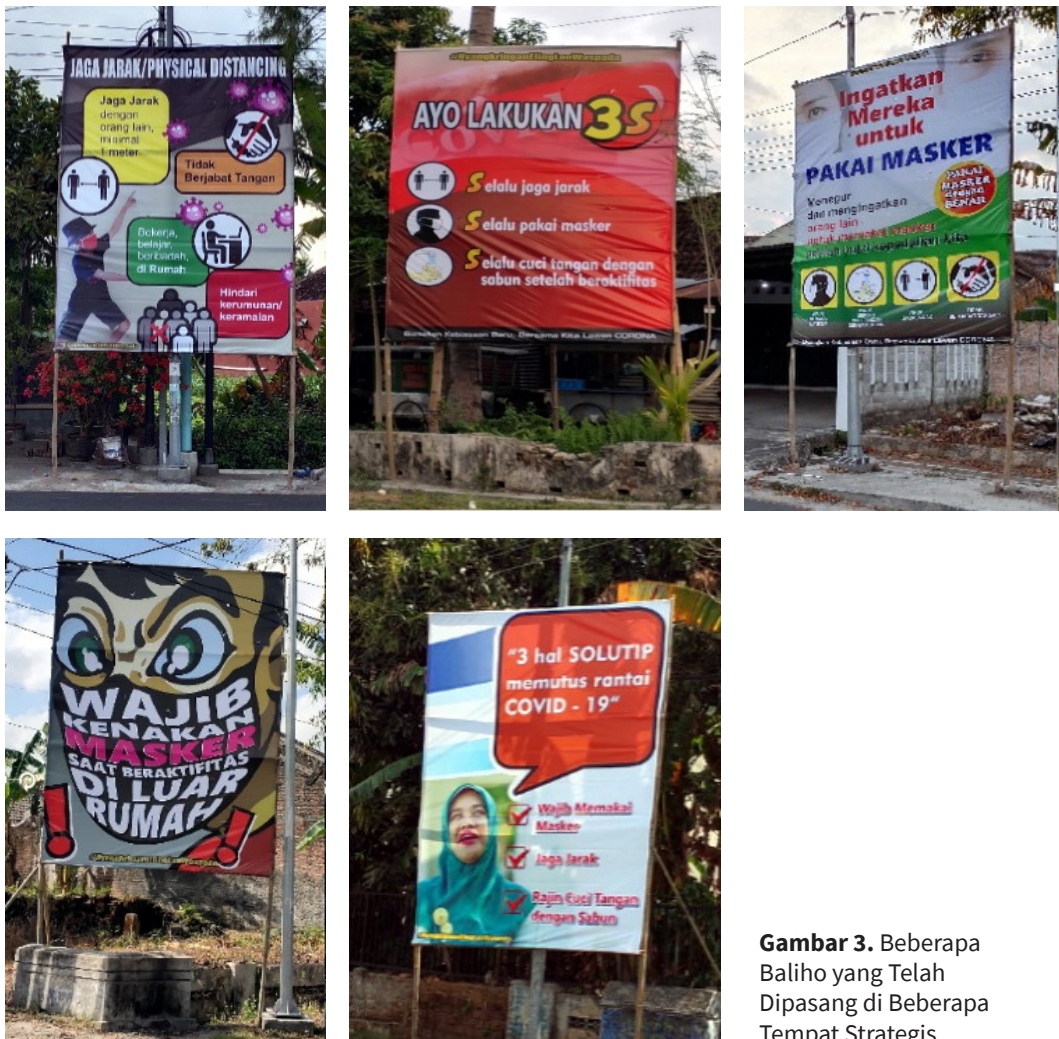
Gambar 3. Beberapa Baliho yang Telah Dipasang di Beberapa Tempat Strategis