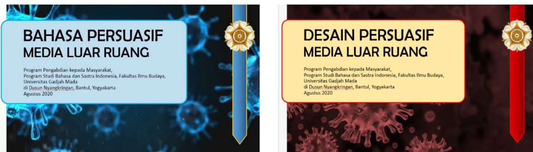
Gambar 1. Cuplikan Layar Materi Pelatihan Bahasa dan Desain Persuasif Media Luar Ruang

Menulis dalam Bahasa Indonesia (Wibowo, 2020) dan “Penggunaan Bahasa Indonesia dalam Surat Dinas” (Wibowo, 2016). Sementara itu, bahan terkait dengan desain media luar ruang disarikan dari berbagai sumber di internet. Kedua materi itu diwujudkan dalam dua PowerPoint berikut ini.