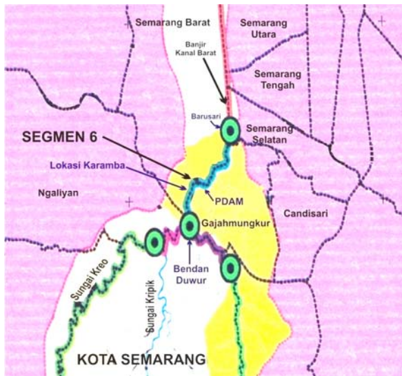
Gambar 1. Denah lokasi pengambilan sampel.

acak, dari perairan yang tidak tercemar yakni dari Balai Benih Ikan Air Tawar di Ungaran. Sampel dianalisis sama seperti sampel ikan dari sungai kaligarang. Hasil analisis HPLC sampel dari Kaligarang dibandingkan dengan sampel ikan dari Balai Benih Ikan untuk menentukan kandungan metallothionein pengikat Cd.