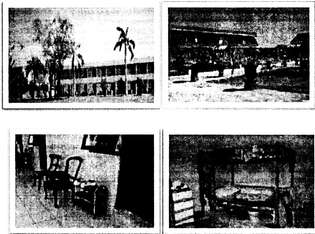
Gambar 3. Asrama Santri PPMS Kendal a dan b asrama santri c. bagian depan kamar, d. bagian dalam kamar

Pola makan santri di pondok sangat teratur karena waktu makan terjadwal. Santri mendapatkan jatah makan minimal tiga kali sehari, yakni sarapan pagi, makan siang, dan makan malam. Di luar jadwal tersebut, santri masih bisa makan karena "sisa" makanan di tempat makan yang tidak diambil oleh petugas dengan tujuan santri yang belum makan masih bisa menyusul, atau santri yang akan makan lagi masih bisa meski dengan lauk yang tidak lengkap. Menu makan santri