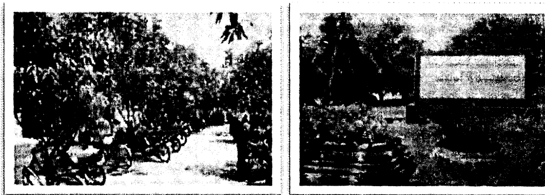
Gambar 4. Jenis tanaman di PPMS (Dok Ngabekti, Juli 2010)

Secara keseluruhan, lingkungan biologis pondok yang hijau, rimbun, sejuk, dan indah merupakan upaya untuk membantu mengurangi perubahan iklim. Hal ini sesuai dengan dimensi lingkungan PPB yang berbunyi “Perubahan iklim yang dapat diatasi melalui konservasi hutan atau penghijauan ( Carbon sink )”. Lingkungan pondok yang hijau, sejuk, dan indah, mendidik siswa untuk melestarikan sumber daya alam hayati.